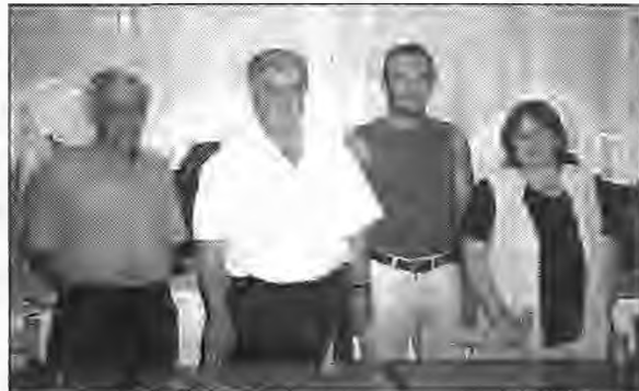
νατόπτες εκμετάλλευσης του φυσικού πλούτου της περιοχής επ' ωφελεία των κατοίκων και προτάθηκε η μετατροπή του Δημοτικού Σχολείου σε Πολιτιστικό Κέντρο.

Τέθηκε ο προβληματισμός σχετικά με τις δυ-