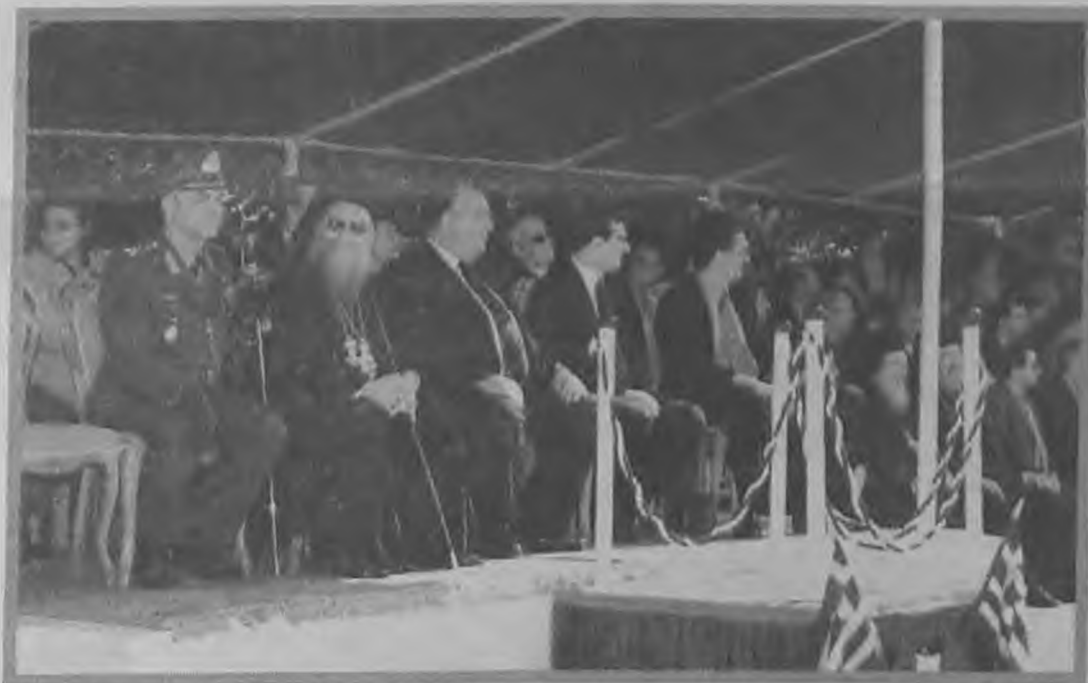
Παρουσία του υπουργού Πολιτισμού κ. Θεόδωρου Πάγκαλου, του υπουργού Δημόσιας Τάξης κ. Μιχάλη Χρυσοχοϊδη και όλων των τοπικών πολιτειακών, στρατιωτικών και θρησκευτικών αρχών, γιορτάστηκε η απελευθέρωση της Βέροιας από τον Τούρκικο ζυγό με την καθιερωμένη παρέλαση μαθητικών και στρατιωτικών τμημάτων.