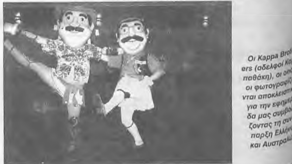
Οι Kappa Brothers (αδελφοί Καρπαθάκη), οι οποίοι φωτογραφίζονται αποκλειστικά για την εφημερίδα μας συμβολίζοντας τη συνύπαρξη Ελλήνων και Αυστραλών.