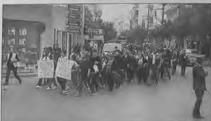
Η φωτογραφία μας είναι από την πορεία των μαθητών του 4ου Δημοτικού και 6ου Γυμνασίου Βέροιας, που κατέληξε στη Νομαρχία Ημαθίας, όπου οι εκπρόσωποι του Συλλόγου Γονέων και Κηδεμόνων επέδωσαν ψήφισμα στο Νομάρχη Ημαθίας.