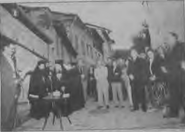
Το διατηρητέο Μπέκα στην Μπαρμπούτα που εγκαινιάσθηκε από τον υπουργό Πολιτισμού κ. Θεόδωρο Πάγκαλο.

Ευχομαστε και ελπίζουμε ότι σε αυτό το Κέντρο θα διατεθούν όλα τα μέσα ώστε να συνεχίσει αυτή την εργασία αλλά και την δυνατότητα να εκδώσει τα διαδοχικά αποτελέσματα αυτών των εργασιών.