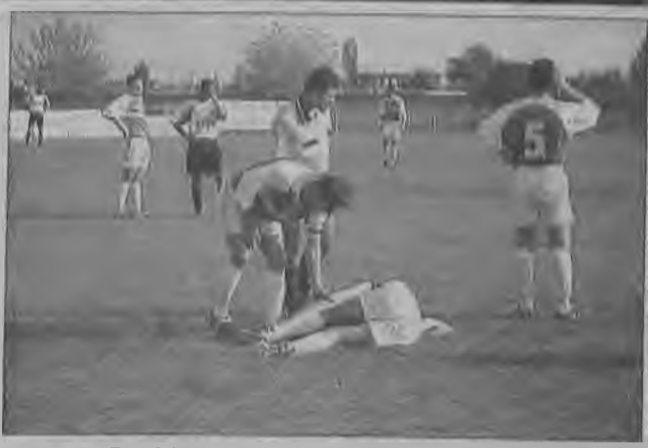
χωρί 1-5, Βαρβάρες - Λευκάδια 5-2, ΑΕΠ - Καβάσιλα 4-1, Πλάτανος - Τρίκαλα 0-1, Ενωση - Κλειδί 4-2, Μακεδονία - Δια- βατός 2-1, Λουτρος - Νικομήδεια 1-3.

Στη βαθμολογία προηγούνται η Αλεξανδρεία και τα Τρικα- λα που έχουν από 24 βαθμούς και ακολουθούν Ροδοχώρι με 22 β., ΑΕΠ με 19 β., Διαβατός με 18 β.