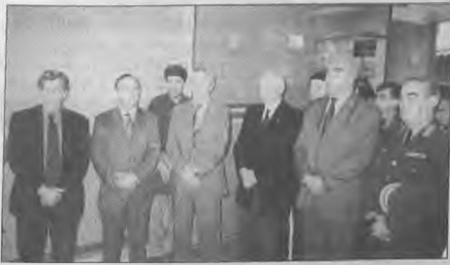
Φωτογραφία από την τελετή των εγκαινίων όπου διακρίνονται από αριστερά οι κ.κ. Γιαννίτσης, Παλαιολόγος, Γικόνογλου, Σπάρτης, Χαλκίδης και ο εκπρόσωπος του Β'Σ.Σ.

Τα νέα γραφεία του Κέντρου Προώθησης Απασχόλησης εγκαινίασε το Σάββατο στη Βέροια ο Υπουργός Εργασίας κ. Γιαννίτσης και τα οποία βρίσκονται στην οδό Π. Τσαλδάρη 1 στην πλατεία Αγ. Αντωνίου. Τον υπουργό συνόδευε και ο υφυπουργός Εργασίας κ. Πρωτόπαπας, ο διοικητής του ΟΑΕΔ κ. Παλαιολόγος και ο αντιπρόεδρος κ. Δανέλης. Παρέστησαν επίσης οι βουλευτές κ.κ. Γικόνογλου, Χαλκίδης, ο Νομάρχης κ. Σπάρτης, ο Αντινομάρχης κ. Σιδηρόπουλος, ο Δήμαρχος Ανθεμίων κ. Καρυπίδης, ο Αστυνο-