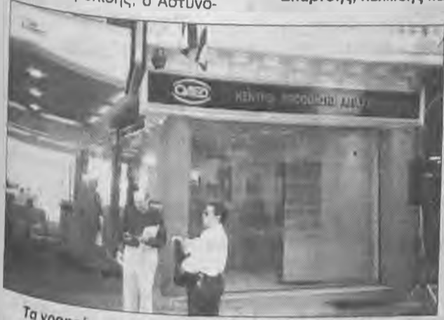
Τα γραφεία του ΚΠΑ στην οδό Π. Τσαλδάρη στη Βέροια.