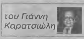
του Γιάννη Καρατσιώλη

1. Κώστα Κόλλα: «Μέγας Αλέξανδρος», ποιητικό δράμα. Ο γνωστός θεατρικός συγγραφέας, ηθοποιός και σκηνοθέτης από τη Νύουσα κ. Κων/νος Κόλλας μας παρουσιάζει έμμετρα το ποιητικό του δράμα «Μέγας Αλέξανδρος - Ο καβαλάρης της ψυχής, το όνειρο του κόσμου». Το έργο είναι θεατρικό και αποτελείται από δυο σκηνές και έχει τον χορό, δύο αφηγήτριες και τον ποιητή, ως τρίτο αφηγητή. Φυσικά υπάρχει η κορυφαία του χορού και 14 πρόσωπα του έργου.