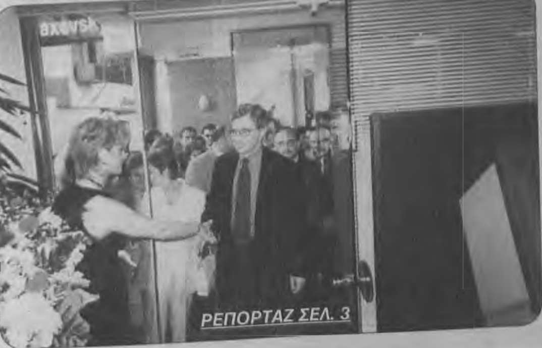
ΡΕΠΟΡΤΑΖ ΣΕΛ. 3