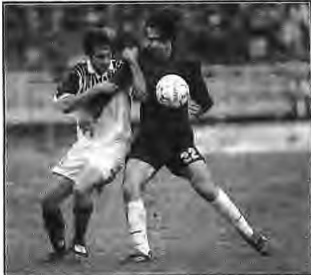
Φάση από τον προηγούμενο αγώνα της Βέροιας με τον Ιωνικό που έληξε 1-1.

✓ Στην Α1 ανδρών του χαντ-μπαλ η ΓΕΒ έχασε ένα ακόμη παιχνίδι στην έδρα της,