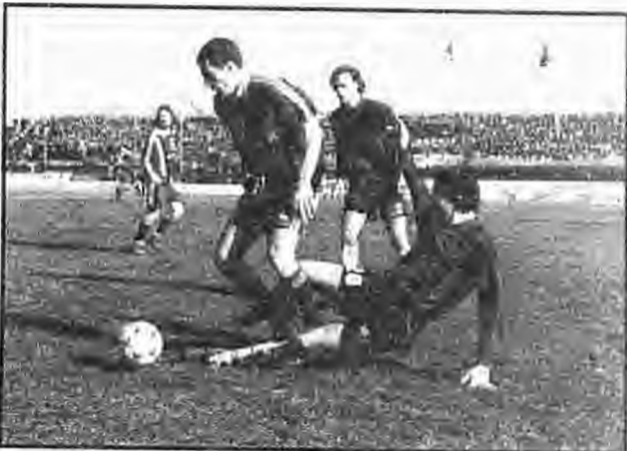
Φάση απο τον αγώνα που έγινε μεταξύ Βεροίας και Παναθηναϊκού που έληξε 0-3.

ρο για τη συνέχεια, αφού ξεκινά μια προσπάθεια μέχρι και την 28η αγωνιστική, στο "Βατό" πρόγραμμα που έχει η ομάδα εντός Παναθηναϊκού Παναθηναϊκό, Καλαμάτα, Αθηναϊκό και εκτός Παναθηναϊκό, Απόλλων, Εθνικό να μαζέψει 15 βαθμούς, οι οποίοι θα της επιτρέψουν να πανηγυρίσει την σωτηρία της, εζι αγωνιστικές πριν το τέλος του πρωταθλήματος οι οποίες είναι σπάνες με πολύ δύσκολους αντιπάλους (εντός ΟΦΗ, ΠΑΟΚ, Ολυμπιακό και εκτός ΑΕΚ, Εθνική, Προοδευτική).