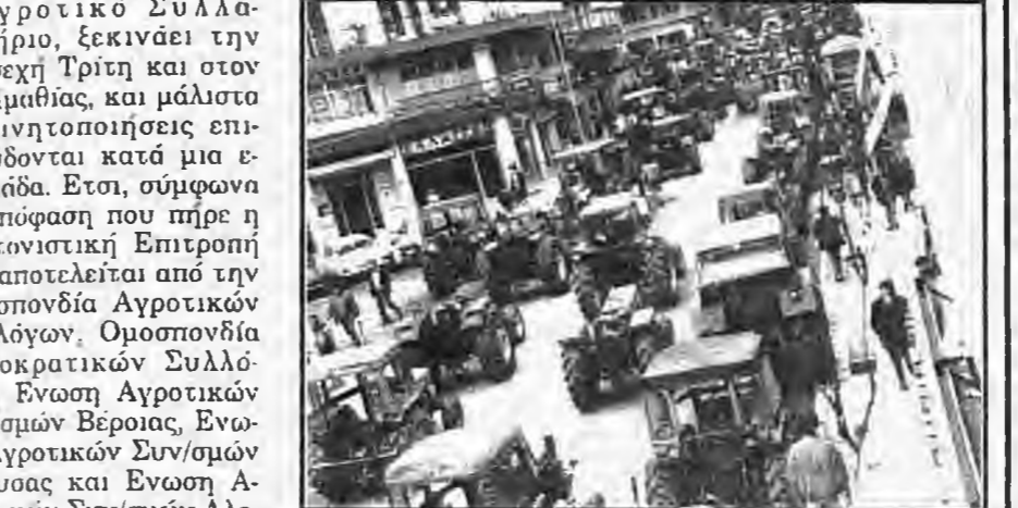
Φωτογραφικό στιγμιότυπο από παλαιότερο αγροτικό συλλογή στην Βεροία.

Αγροτικό Συλλογή, ξεκινάει την προερχή Τρίτη και στον Ν. Ημαθίας, και μάλιστα οι κινητοποιήσεις επισημαίνονται κατά μια εβδομάδα. Ετσι, σύμφωνα με απόφαση που πήρε η Συντονιστική Επιτροπή που αποτελείται από την Ομοσπονδία Αγροτικών Συλλόγων, Ομοσπονδία Δημοκρατικών Συλλόγων, Ένωση Αγροτικών Συν/σμών Βεροίας, Ένωση Αγροτικών Συν/σμών Νάουσας και Ένωση Αγροτικών Συν/σμών Αλεξάνδρειας, όλα τα τρακτέρ θα συγκεντρωθούν στις 11.00 π.μ. μπροστά στην Εφορία Βεροίας (δρόμο Βεροίας - Μακροχωρίου). Οι περιφερειακές συγκεντρώσεις θα γίνουν με ευθύνη των μελών της Συντονιστικής Επιτροπής, ως εξής: