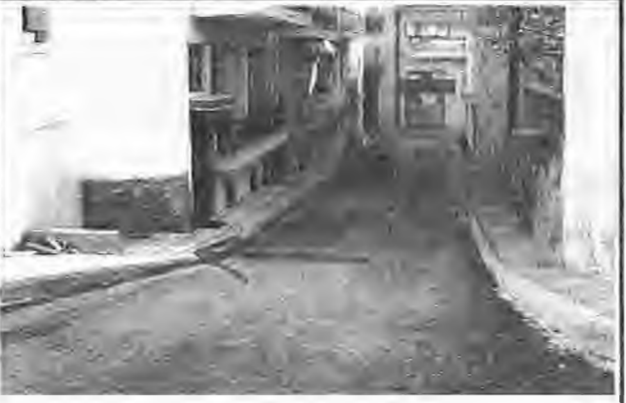
Αν και η φωτογραφία μας δεν μπορεί να αποδώσει ακριβώς αυτό που βλέπουμε να καταγράφουμε, πιστεύουμε πως οι αρμόδιες υπηρεσίες του Δήμου Βέροιας, θα το διαπιστώσουν... Ιδίως όμως.

Πρώτοι στις εκδηλώσεις πνευματικού και καλλιτεχνικού χαρακτήρα οι παλιοί πρόσκοποι της Βέροιας, εντυπωσίασαν με την παρουσία τους στη Στέγη