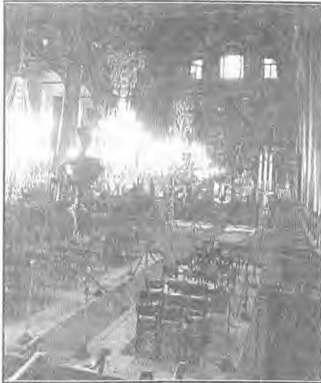
Ο πατριαρχικός ναός του Αγίου Γεωργίου στην Κωνσταντινούπολη

Αυτό το πληροφορούμαστε από ένα απλό, λιγότερο, "διαβιβαστικό", έγγραφο προς τον Μητροπολίτη της Βέροιας - Νάουσας, με το οποίο αποστέλλεται το ίδιο το Σώμα της καταγγελίας, προκειμένου να απαντήσει τούτος σε αυτήν.