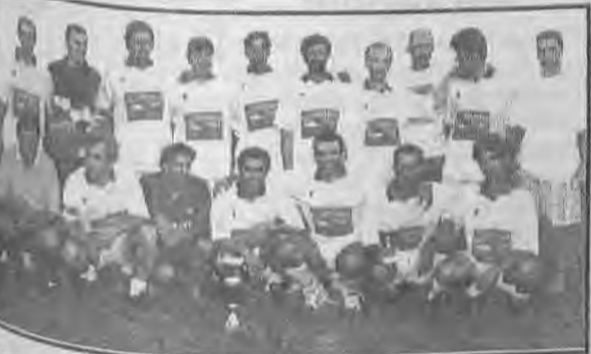
Η πρωταθλήτρια ομάδα του ΜΟΥΝΤΙΑΛ '97 ΑΘΛΕΤ'Σ ΦΟΥΤ.

Ας χειροκροτήσουμε τα σοφά κεφάλια της ομοσπονδίας μπάσκετ που δεν αναβάλλουν τους αγώνες.