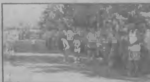
Αρκετοί φιλάθλοι καθημερινά βρίσκονται ο το Ταγαροχώρι για να παρακολουθήσουν από κοντά το αρχικό στάδιο προετοιμασίας.

Χθες ο κ. Κίρτσου μαζί με τον κ. Γιοβαννούλη επισκέφθηκαν το Σέλι για τις τελευταίες λεπτομέρειες.