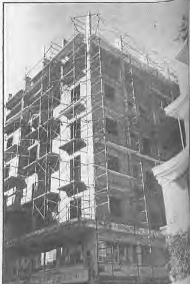
1967-1997. Ιστορία 30 χρόνων. 30 χρόνια ιστορίας της πόλης. ΣΥΜΠΕΡΑΣΜΑ: Στη χώρα μας και τα μικρά ακόμη έργα χρειάζονται το πέρασμα γενεών για να ολοκληρωθούν.

Τέλος στις "πονηρές" εποχές που ζούμε υπάρχουν πιο δοκιμασμένες ονομασίες όπως "Φίλιππος", "Αλέξανδρος", "Μακεδονία" κλπ.