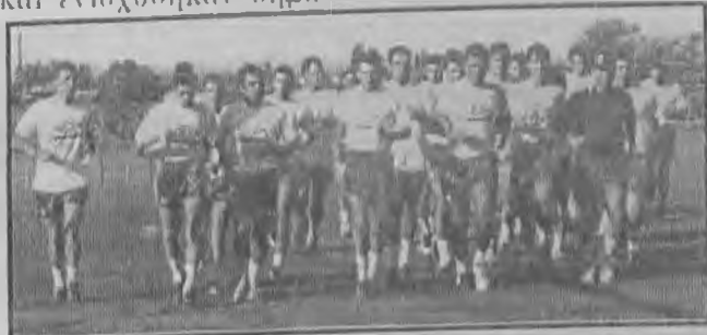
30 επαγγελματίες και ερασιτέχνες παίρνουν μέρος στην προετοιμασία της Βέροιας ενόψει της νέας αγωνιστικής περιόδου που ξεκίνησε στο Ταγαροχώρι.

Ισως από τις ομάδες της κατηγορίας της Βέροιας μόνο η Παναχαϊκή, ο Πανιώνιος και ο Πανηλιακός αποτελούν εξαίρεση και ενισχύθηκαν σημα-