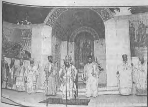
Η φωτογραφία μας είναι από τον Εόρτιο Εσπερινό χοροστατούτος του Σεβασμιωτάτου Μητροπολίτη μας και συγχοροστατούτων άλλων 10 Αρχιερέων στο Βήμα του Αποστόλου Παύλου.

Ολοκληρώθηκε με επιτυχία το Διεθνές Συνέδριο για τον Απόστολο Παύλο