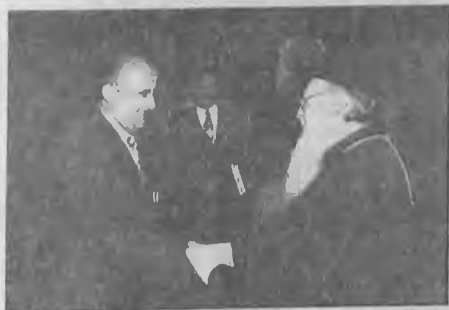
Στημιότυπο από την πρώτη εθιμοτυπική επίσκεψη του κ. Γ. Χιονίδη στον Οικουμενικό Πατριάρχη κ. Βαρθολομαίο (10-6-97). Στο μέσο διακρίνεται ο δήμαρχος Βέροιας κ. Γιάννης Χασιώτης, χαμογελώντας, ανταποκρινόμενος άλλωστε, στην φιλική ατμόσφαιρα θερμής οικειότητας που επικράτησε...

Τον κ. Χιονίδη παρέλαβε την ημέρα της άφιξής του, στο αεροδρόμιο της Κωνσταντινούπολης, το πατριαρχικό αυτοκίνητο! Το βράδυ της ίδιας ημέρας, 29 Ιουνίου, εφόρτη του Απ. Παύλου, ο Οικουμενικός Πατριάρχης Κωνσταντινουπόλεως Βαρθολομαίος παρέθεσε δείπνο εις τον Οφφικιούχο του Οικουμενικού Πατριαρχείου ("Αρχοντα Νοτάριο"), στο οποίο οι δύο άνδρες εί-