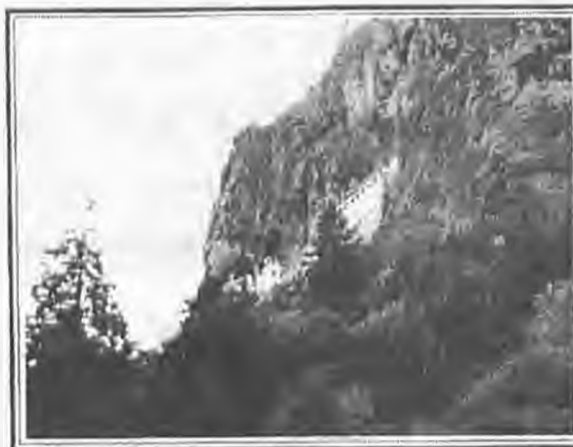
Η Παναγία Σουμελά του Πόντου, σήμερα

(Τραπεζούντα - Τονιά - Μονή Σουμελά - Βαϊτούμ - Τάκοβα και Τυφλίδα)