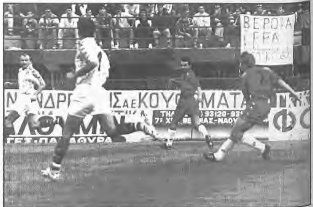
Φάση από τον χθεσινό αγώνα κυπέλλου της Βέροιας με τον Απόλλωνα όπου διακρίνονται ο Ευριπίδης Κατσαβός, (δέχτηκε την τρίτη κίτρινη κάρτα και δεν παίζει στο παιχνίδι με τον Πανηλειακό) και Μίλκο Πέτκοβιτς σε μια επιθετική προσπάθεια της ομάδας τους.

Η "γκαντεριά" με τις χαμένες ευκαιρίες, σταμάτησε στο 75', αφού τότε ο Αβραμίδης από δεξιά εκτέλεσε κόρνερ, ο Μητρόπουλος έπιασε γυριστή