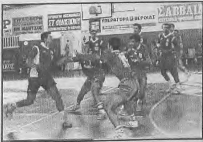
Ξαναρχίζει το Σαββατοκύριακο τα πρωταθλήματα χάντ-μπωλ της Α1 κατηγορίας με τις ομάδες των ανδρών να δίνουν δύσκολους αγώνες ενώ στις γυναίκες έχουμε το τοπικό ντέρμπυ ανάμεσα στον Φίλιππο και την

ένα παιχνίδι που όπως πάντα έχει το δικό του ξε-