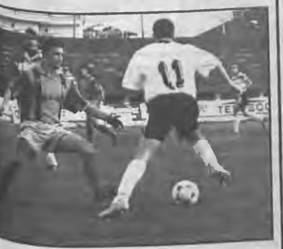
ΑΕΠ Βέροιας υποδέχεται τον Αιγινιακό και οι δύο ομάδες...

Καστοριά - Δόξα Μακρ. Βορδαϊκός - Εθνικός Κατ. Μουδανιά - Ηρακλής ΛΑΡ.