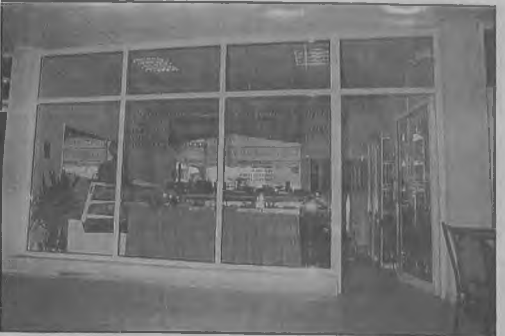
Στο Εμπορικό Κέντρο "Γεώργιος Γεννηματάς" θα βρείτε όλων των ειδών τα καταστήματα. Από ζαχαροπλαστείο μέχρι και καφεκοπτείο...