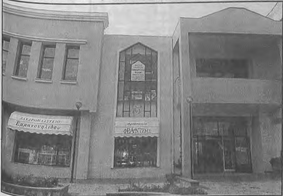
Η εξωτερική πλευρά του Εμπορικού Κέντρου Βέροιας, με την κεντρική είσοδο. Ένα κτίριο αρμονικά δεμένο με την συνολική εικόνα της παλιάς αγοράς...