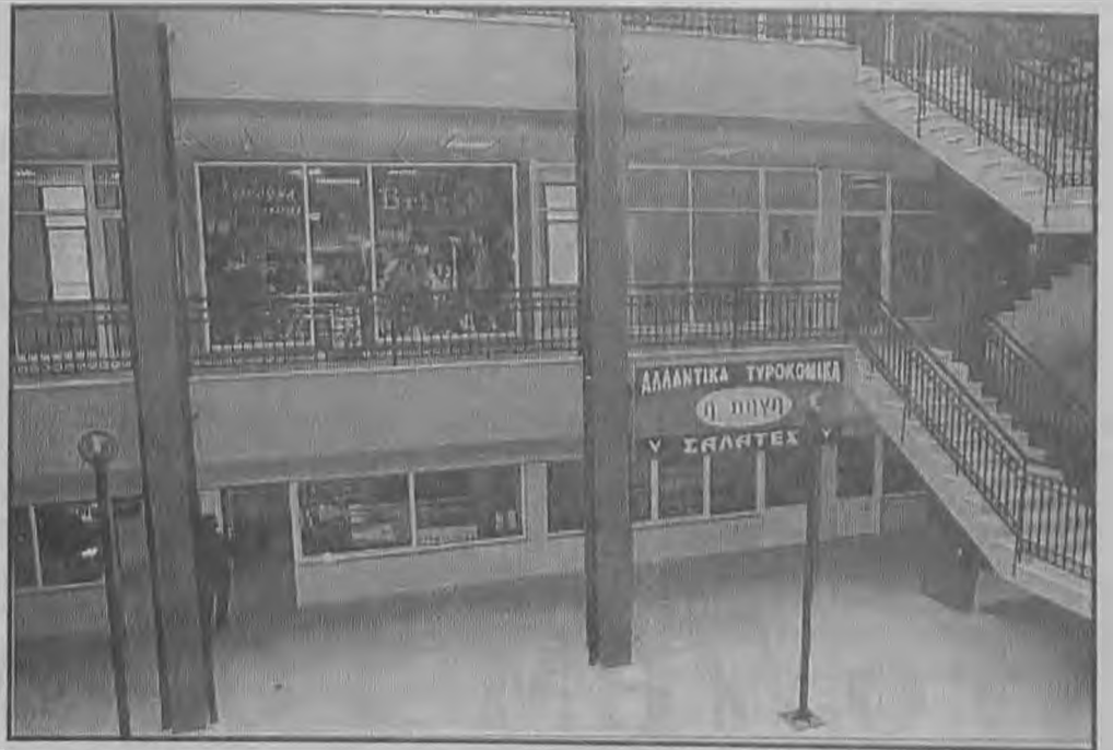
Σε πλήρη λειτουργία βρίσκονται τα καταστήματα αν και ακόμη ο κοινόχρηστος χώρος του εμπορικού κέντρου δεν διακοσμήθηκε σύμφωνα με τα αρχικά σχέδια, κάτι που θα γίνει στις προσεχείς ημέρες.