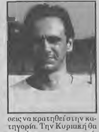
οις να κρατηθεί στην κατηγορία. Την Κυριακή θα παλαίει για τους τρεις βαθμούς στην Καστοριά όπου θα αντιμετωπίσει την τοπική Αθλητική Ένωσις.

Στα πλαίσια της 11ης αγωνιστικής του πρωταθλήματος της Δ' Εθνικής, η ΑΕΠ Βερούια για δεύτερη συνεχόμενη Κυριακή αγωνίζεται ως γηπεδούχος, φιλοξενώντας αυτήν την φορά τα Σήμαντρα. Σίγουρα η εισιφία από την πρώτη θέση έχει χαθεί και πλέον η Παναθηναϊκή ομάδα, κυνηγώντας τους βαθμούς για την σωτηρία δεν έχει περιθώρια απόδοσης βαθμών εντός έδρας.