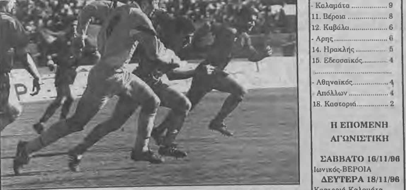
Άλλοι αγώνες της αγωνιστικής αυτής μετατέθηκαν για την επόμενη μέρα...