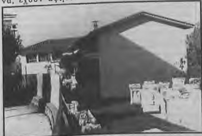
Το αρχαιολογικό μουσείο Βέροιας το οποίο υποβαθμίζεται συνεχώς, μιας και στερείται χώρους έκθεσης των πολλών ευρημάτων της περιοχής μας, καθώς και με την σημαντική μείωση των επισκεπτών του.

περιθώριο το κεντρικό μουσείο της Ημαθίας, το αρχαιολογικό μουσείο της Βέροιας.