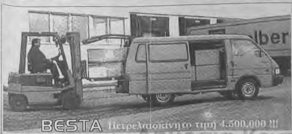
BESTA Πευρελατοκίνητο τιμή 4.500.000 !!!