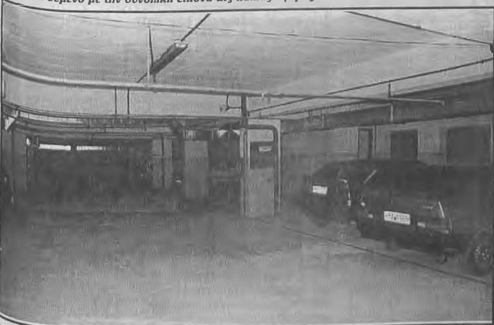
Και για την αποφυγή της ταλαιπωρίας στους υπόγειους χώρους λειτουργεί διάδροφο πάρκινγκ αυτοκινήτων...