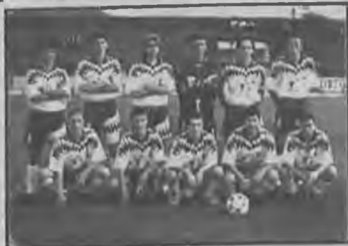
Η ομάδα της Δόξας Μακροχωρίου.

Με μοναδικό σκοπό τους 3 βαθμούς, που θα τους απομακρύνουν από την διαχωριστική γραμμή του υποβιβασμού, οι ομάδες της Ημαθίας στην Δ' Εθνική η ΑΕΠ και η Δόξα Μακροχωρίου αγωνίζονται την Κυριακή στα πλαίσια της 12ης αγωνιστικής. Η Ποντιακή ομάδα ύστερα από δύο συνεχόμενα παιχνίδια στο γήπεδο της, παίζει εκτός Ημαθιακών συνόρων και συγκεκριμένα στα Γρεβενά με τον τοπικό Αγ. Γεώργιο που είναι ουραγός στην βαθμολογία, χωρίς βαθμό στο ενεργητό του.