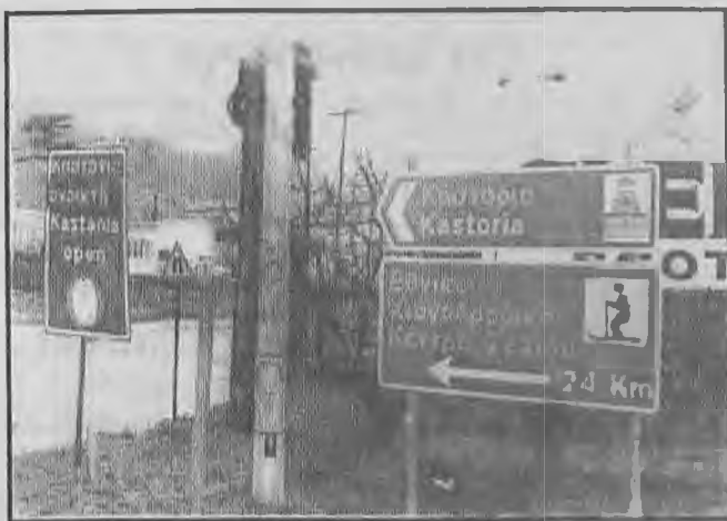
Χαρακτηριστική η φωτογραφία μας στον κόμβο της οδού Πιερίων και της Νέας Περιφερειακής οδού στη Βέροια, όπου τοποθετήθηκε η πινακίδα που δείχνει το δρόμο για την Καστοριά με την ένδειξη της Βυζαντινής πόλης.

Μία από τις αιτίες αυτές που μας οδηγούν στην άποψη αυτή, είναι οι σημάνσεις σε διάφορες κεντρικές οδικές αρτηρίες του Νομού και αφορούν άλλους Νομούς.