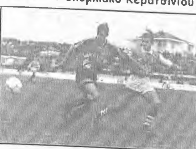
Το Βελισσάριο υποδέχεται την Κυριακή η ΑΕΠ, στα πλαίσια της 29ης αγωνιστικής του πρωταθλήματος της Γ' Εθνικής. Νίκη και μόνο νίκη βλέπει η Παντιακή ομάδα που διατηρεί βάσιμες τις ελπίδες της για σωτηρία.