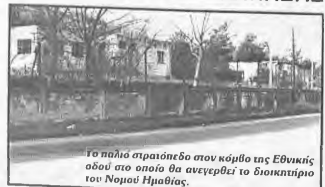
Το παλιό στρατόπεδο στον κόμβο της Εθνικής οδού στο οποίο θα ανεγερθεί το διοικητήριο του Νομού Ημαθίας.