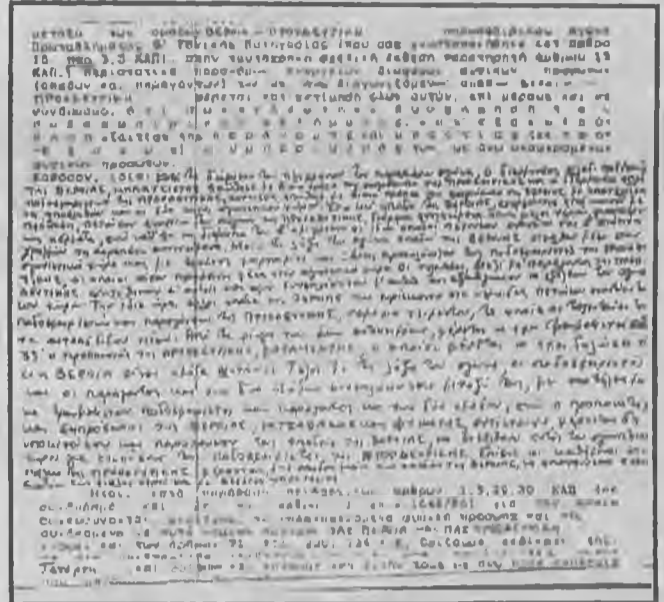
νιστικό χώρο και με άσεμνες χειρονομίες και ύβρης προηλάκιζαν τους ποδ/στές της Προοδευτικής, οι οποίοι είχαν παραμείνει μέσα στον αγωνιστικό χώρο. Οι τελευταίοι, μαζί με παράγοντες της Προοδευτικής επιτέθηκαν σ' αυτούς και αφού συνεπλάκησαν μ' αυτούς τους εξαναγκάσαν να εξέλθουν του αγωνιστικού χώρου.