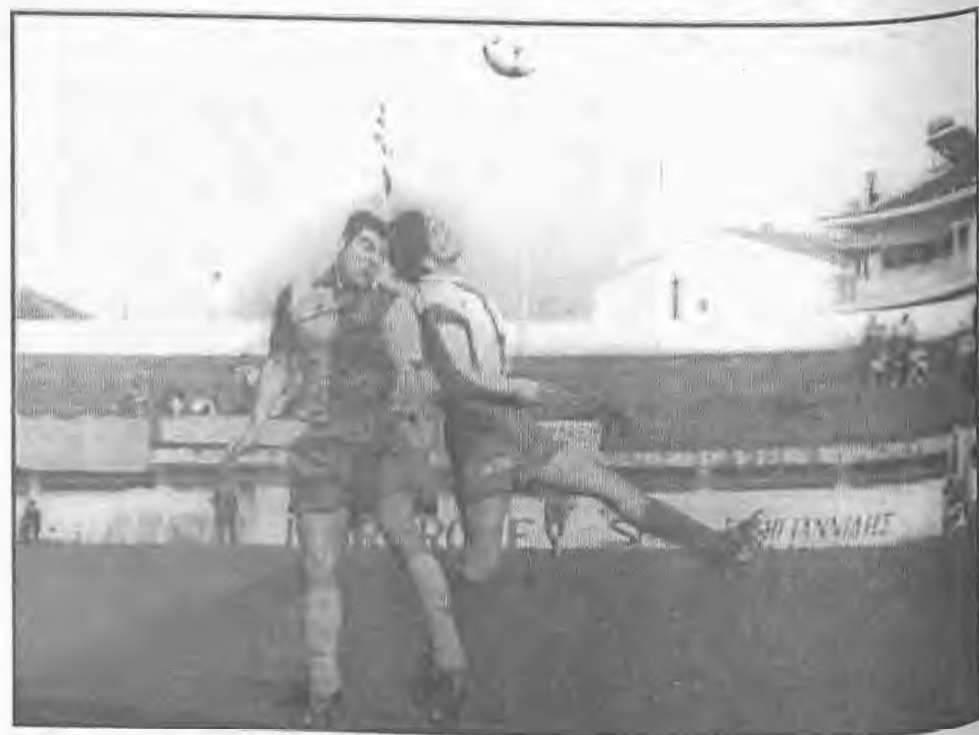
Ο Μπουτσακτής που διακρίνεται στην φωτογραφία μας σε παλαιότερο αγώνα της ομάδας των αντίκρουσε στην Αριδαία την έκτη κίτρινη κάρτα και δεν θα παίξει στα δυο επόμενα παιχνίδια της ΑΕΠ.

Φιλική πεντάρα επί της συμπολιτισσας της ΑΕΠ πέτυχε η Βέροια σε φιλικό που έγινε στο Ταγαροχώρι. Χάτ τρικ πέτυχε ο Σο-