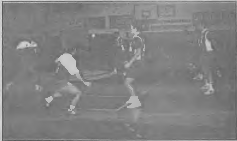
Δuo νίκες θέλει στα πλεϊ-σφ ο Φίλιππος κόντρα στον Λούκα για να ιεράσει στην διεκδίκηση της πρώτης θέσης.