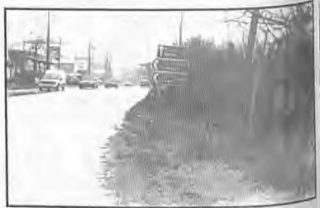
Το σημείο αυτό στο οποίο η Βέροια... απέχει τρία χιλιόμετρα βρίσκεται εντός της πόλης.