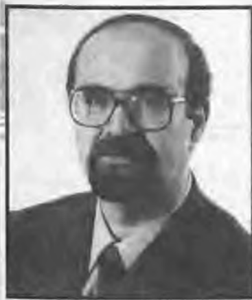
Ο Περιφερειακός Διευθυντής Ημαθίας κ. Ζήσης Μητλιάγκας

Την ανοιχτή συνεδρίαση του Δημοτικού Συμβουλίου τη Δευτέρα 6 Φεβρουαρίου παρακολούθησε ο Περιφερειακός Διευθυντής κ. Ζήσης Μητλιάγκας, καθώς και εκπρόσωποι των φορέων της πόλης, οι οποίοι και έκαναν τοποθετήσεις και παρατηρήσεις επί της μελέτης και του όλου προβλήματος.