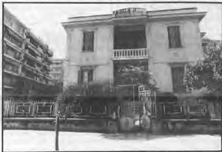
Το νεοκλασικό σπίτι των Αφών Βλαχογιάννη που δωρίζεται για να στεγαστεί σ' αυτό Μουσείο Μακεδονικού Αγώνα.

να υπογραφεί, κατ' αρχήν, προσύμφωνο της δωρεάς, για να ακολουθήσει το οριστικό δωρητήριο συμβόλαιο με τους όρους της δωρεάς. Μεταξύ των όρων θα περιλαμβάνεται, εκτός του σκοπού, και η σύσταση διαχειριστικής επιτροπής με Πρόεδρο τον εκάστοτε Μητροπολίτη Βέροιας.