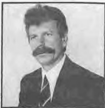
Ο Νομάρχης Ημαθίας κ. Ανδρ. Βλαζάκης

στην Ημαθία για ποιά λόγο, ένα τόσο κυρίαρχο θέμα επιλογής, όπως είναι το Μουσείο δεν προχωράει στο Βαθμό που θα θέλαμε, η δεν προχωράει καθόλου ικανοποιητικά. Το Νομαρχιακό Συμβούλιο απασχόλησαν και τα ζητήματα διάσωσης των Μακεδονικών Τάφων στο Νομό και κύρια στην περιοχή της Νάουσας όπου παρουσιάζονται τα μεγαλύτερα προβλήματα, κυρίως στον Τάφο της Κρίσεως».