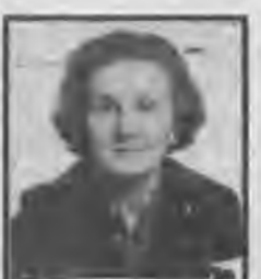
Αγαπημένη μητέρα, γιαγιά, αδελφή και θεία

Τα παιδιά της, τα εγγόνια, οι αδελφοί, τα ανήψια, οι λοιποί συγγενείς