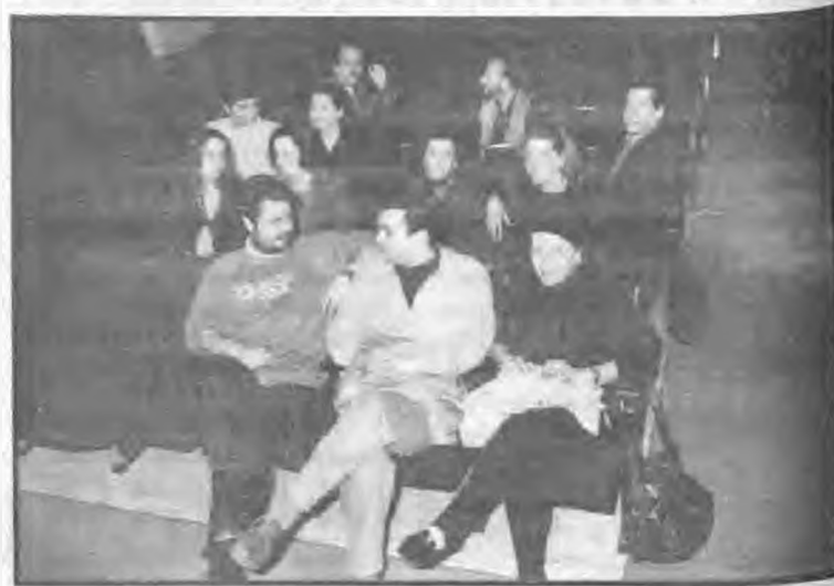
Οι συντελεστές της παράστασης

εκατοντάδες παραπάνω ανά τον κόσμο και με δύο ταινίες με ερμηνείες του βασικού γυναικείου ρόλου (Νόρα) τις Τζέην Φοντα και Λιβ Ούλμαν.