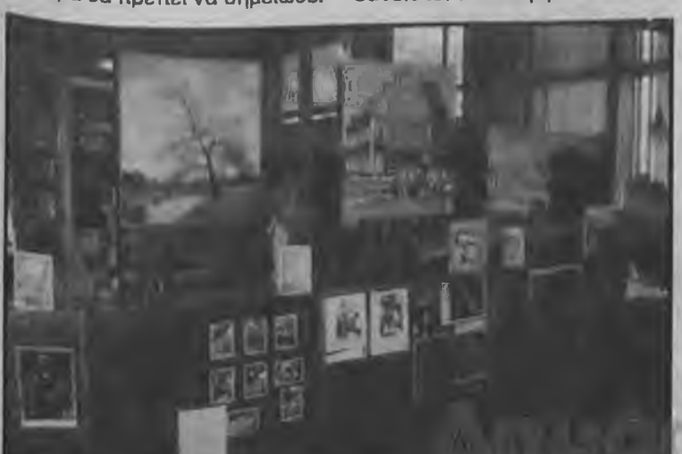
Το αναγνωστήριο για παιδιά της Δημόσιας Βιβλιοθήκης Βέροιας;

Η Δημόσια Βιβλιοθήκη της Βέροιας παρουσίασε σε ειδικές διοργανώσεις το αυτοποιημένο σύστημα καταλόγων που εφαρμόζει ήδη. Οι διοργανώσεις αυτές έγιναν για τις βιβλιοθήκες