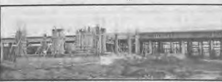
Οι κατασκευαζόμενες εγκαταστάσεις της Μονάδας Βιολογικού Καθαρισμού

Τα λύματα θα φθάνουν στην Μονάδα του βιολογικού καθαρισμού με έναν μεγάλο αγωγό και θα υψιστανται δύο χωριστές επεξεργασίες, με τη χρη-