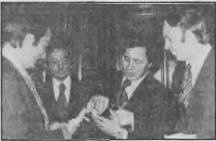
Ο Λόρδος Ουεν ως υφυπουργός Εξωτερικών της Μ. Βρετανίας, το 1976 δέχεται αρχαίο Ελληνικό νόμισμα, δώρο του Μ. Ανδρόνικου.

Επ' ευκαιρία, επιτρέψτε μου να σας στείλω την σχετική φωτογραφία της δωρεάς του Μακεδονικού Νομισματοσίου, που αν