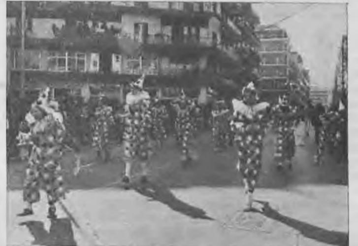
Οι κλέουν παρελαύνουν στην οδό Μητροπόλεως και μετά δεύτερος δεν υπάρχει.

1.— Η Γ1 τάξη του 4ου Λυκείου Βέροιας «Θρεφτάρια»,