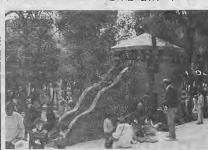
Μετά τα εγκαίνια του πρώτου τμήματος του Μουσείου Παιδικής Φαντασίας της Αθήνας τα παιδιά κοπέλυσαν τους χώρους του παίζοντας και δημιουργώντας.

Ο μέγας τόπος αντιδράσεως Αθηναίων και γιορτάς απήχθη