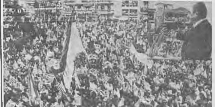
Απόφαση της συγκέντρωσης στο χώρο της πλατείας Βρολίου. Επάνω δεξιά ο κ. Μητσότακης που μίλησε από ειδική εξέδρα που στήθηκε στην πλατεία.