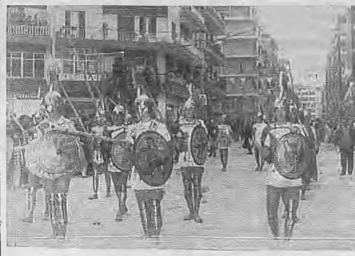
Η «Μακεδονική Φάλαγγα» του Μ.Σ. Σφηκιάς.