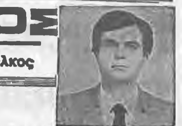
Πρώτη η ΑΕ Ποντίων