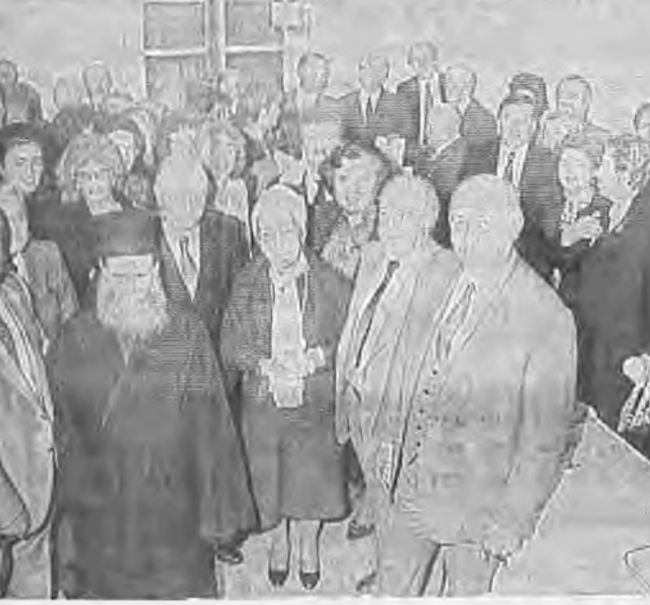
Στιγμιότυπο από τα εγκαίνια των ιδιόκτητων γραφείων του Συλλόγου Βεροίων Θεσ)νίκης.

συλλογος ιδρύθηκε στις 8 Φεβρουαρίου 1940 από τους, Αθανάσιον Καζινάρην, γιοσήρ, Εμμ. Παπαδήμαν, βιομήχανο, Θωμάν Τζικαν, μηχανο, Σπύραν Σίφον, τυπογράφο, Χριστόδουλον Σπαμπούλην, διημήτρη, Γεώργιον Κανάκη, κουρέα, Δημοσθένην Στγγαν, υποδηματοποιό και Εμμανουήλ Καλογερόπουλον, «σαρωθροπαά»