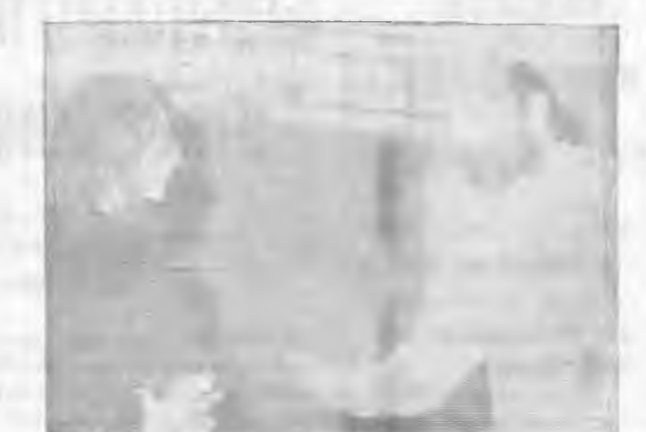
Στιγμιότυπο από τις δοκιμές του νέου έργου του ΔΗ.ΠΕ.ΘΕ.

Αρχισαν και συνεχίζονται εντατικά οι δοκιμές για το ανέκδοτο του τρίτου έργου της χειμερινής περιόδου 86-87 από το ΔΗ.ΠΕ.ΘΕ Βέροιας. Όπως ήδη έχει ανακοινωθεί πρόκειται για το θεατρικό έργο του Γρ. Σβαρνόπουλου «Στέλλα Βιολάντη».