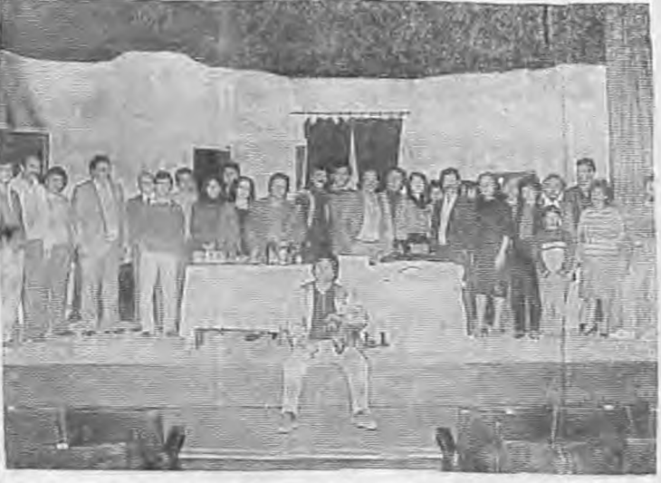
Στημμάτιο από το κόψιμο της βασιλόπιτας του ΔΗ.ΠΕ.ΘΕ.

Την παράσταση της Κυριακής παρακολούθησε ο Στρατηγός κ. Μαρκόπουλος και οι επιτελείς του. Το πρόγραμμα των παραστάσεων έχει ως εξής: Παρασκευή 10)1)86 απογευματινή ώρα 6 στη Στέγη. Σάββατο 11)1)86 βραδυνή ώρα 9 στη Στέγη. Κυριακή 12)1)86 απογευματινή 6 η ώρα στη Στέγη και βραδυνή στις 9 μ.μ. Σάββατο 18)1)85 βραδυνή η ώρα 9 στη Στέγη. Κυριακή 19)1)86 απογευματινή 6 η ώρα και βραδυνή στις 9 στη Στέγη. Εν τω μεταξύ στα ενδιαφέροντα δίνονται παραστάσεις για το σχολείο σε ειδικές παραστάσεις.