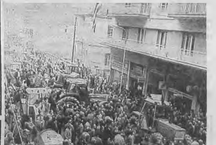
Στημιότυπο από τη συγκέντρωση των Αγροτικών Δημοκρατικών Συλλόγων Ημαθίας. Τα τρακτέρ είναι στραμμένα προς την είσοδο της Νομαρχίας.

Προς τους διαμαρτυρούμενους αγρότες μίλησαν απ' τα γραφεία της