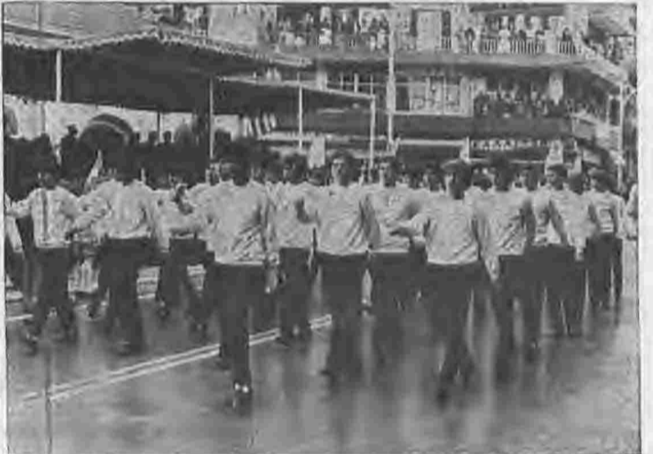
Ευθυμείς και γεμάτοι ζωντάνια παρέλασαν οι μαθητές της Βέροιας την 25η Μαρτίου κερδίζοντας τα θερμά χειροκροτήματα του λαού που τους παρακολούθησε.

Επεισόδια σημειώθηκαν στην Εκκλησία του Αγ. Αντωνίου μετά την επίσημη δοξολογία με αφορμή τα λόγια που εκφώνησε μέσα στο Ναό ο ορισμένος από τη Νομαρχία ομιλητής της ημέρας κ. Ιωάν. Ταυρίδης, δυνάτης του 16ου