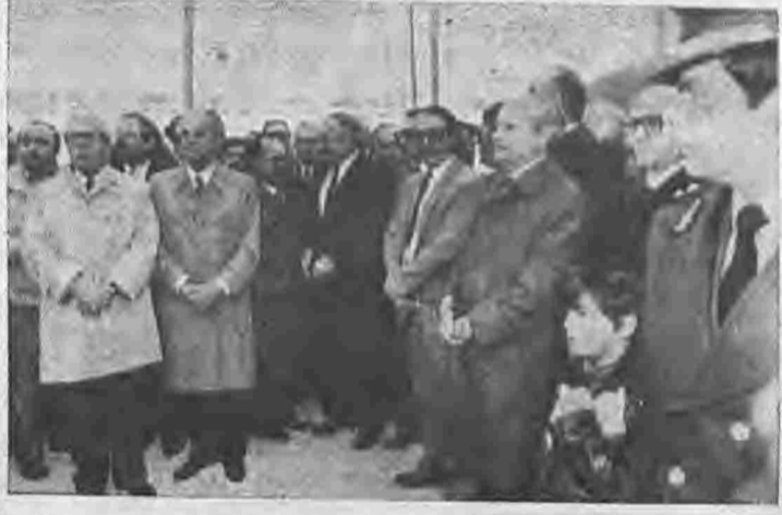
Στιγμιότυπο από τα εγκαινία του Υδροηλεκτρικού Σταθμού Ασωμάτων