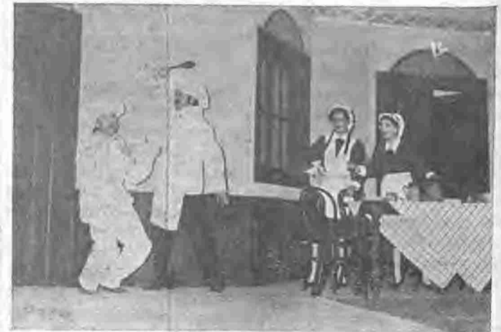
Στημμάτυπο από την «Τύχη της Μαρούλας» που ανέβασε το ΔΗΠΕΘΕ

Με επιτυχία δόθηκε την Πέμπτη 21 Φεβρουαρίου στην Αντωνιάδα Στέγη Γραμμάτων και Τεχνών η επίσημη πρεμιέρα της μουσικής ηθογραφικής κωμωδίας του Δημ. Κορομηλά «Η τύχη της Μαρούλας» που ανέβασε το Δημοτικό Περιφερειακό Θέατρο της Βέροιας.