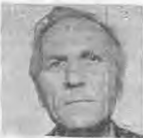
Η σύζυγος — Τα παιδιά του Τα αδελφά

Παρακαλούμε όλους τους συγγενείς και φίλους να έρθουν και να ενώσουν μαζί μας τις δεήσεις τους προς τον Υψίστο