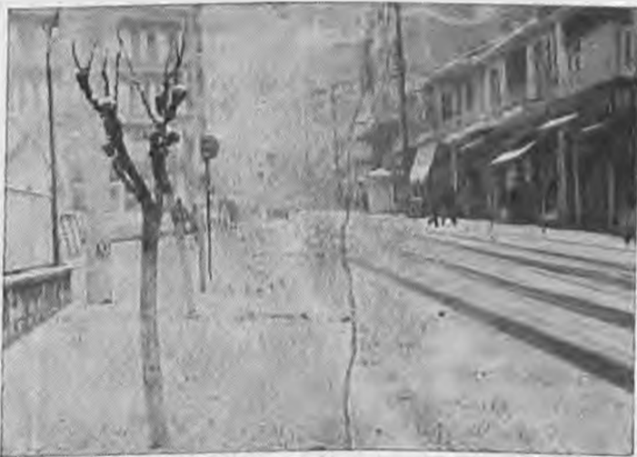
Σημειώματα από τη χιονόπτωση της Δευτέρας στην οδό Μητροπόλεως. Το χιόνι και η παγωνιά παρόρασε στο ελάχιστο την κίνηση στο δρόμο.