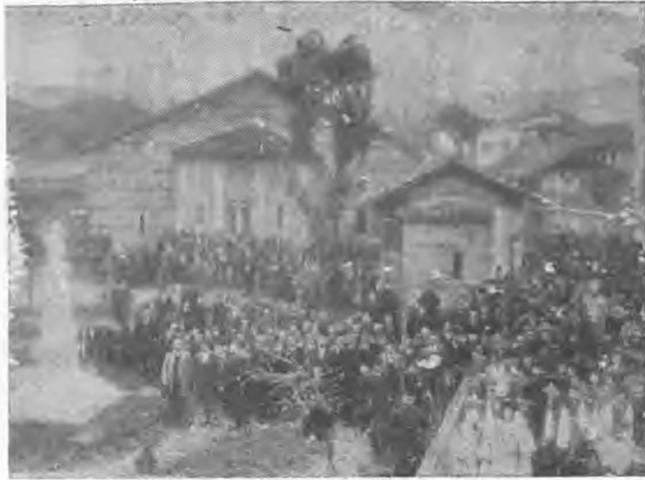
1902. Γιορτή των Τριών Ιεραρχών στη Βέροια.

Οι μαθητές γονατιστοί μπροστά στο άγαλμα θα ψάλλουν τον αρχαιοπρεπή ύμνο προς τιμή του ευεργέτη της Βέροιας: Εν ήχοις φθόγγων εναρμονικών σε ανημνυόμεν γονυπετείς κλεινέ προστάτα σεπτών ταμείων ευεργεσάς και αρετής Σε Ροκτιβάν γραφισμέν στεφάνοις ύμνον φέρομεν.