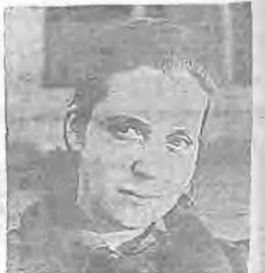
Η γνωστή η ανίστρα Δάμο Ευνοχιδίου που θα εμφανιστεί στην πρώτη Μουσική Εβδομάδα της Βέροιας

Συναυλία με τη Δάμο Ευνοχιδίου (πιάνο) και Βαρθ. Τσαμπαλή — Τρικολδή (τραγουδι) β) Συναυλία με τη χορωδία του πανηπιστημίου Θεσσαλονίκης.