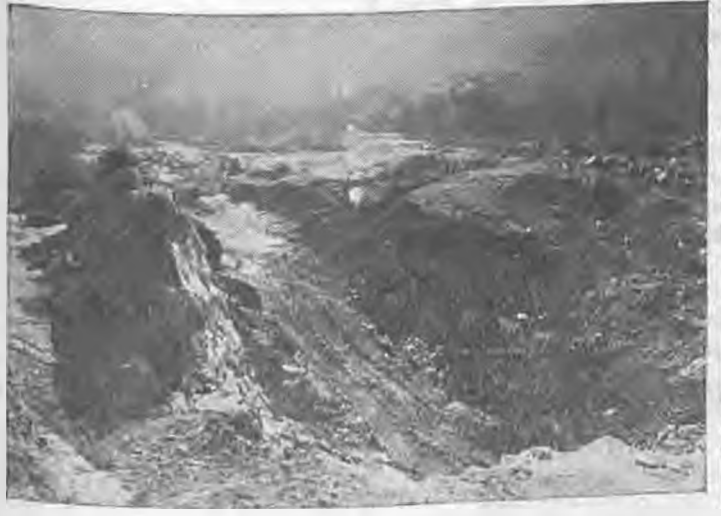
Η άλλοτε πανέμορφη κοιτή του Λιανοβροχίου όπως κατόντησε μ' όλων α γεμάτα μπάζα!

Στα τελευταία χρόνια τα μηχαν- ήματα του Λατομείου εργάζονται τότε από τη μία μεριά της όχθης και τότε από την άλλη. Οι γεροί βράχοι, από σκληρή πέτρα οι πε-