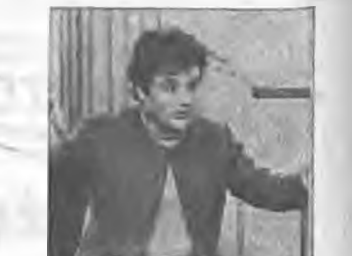
Ο συνθέτης και μαέστρος Θεόδ. Αντωνίου

Στην ίδια ανακοίνωση ακόμα γίνεται ότι χωροκαταστάσια της ασηνής του έργου είναι ότι πάλι και Δάμα, η Παιλιόσκαϊ σέλιω για ανιεύνηση το κλέσμα της