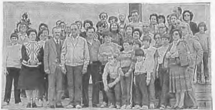
Οι ροταριανοί της Βέροιας με τις οικογένειές τους που φιλοξενήθηκαν στο Καμερίνο της Ιταλίας από τον αντίστοιχο Όμιλο της πόλης