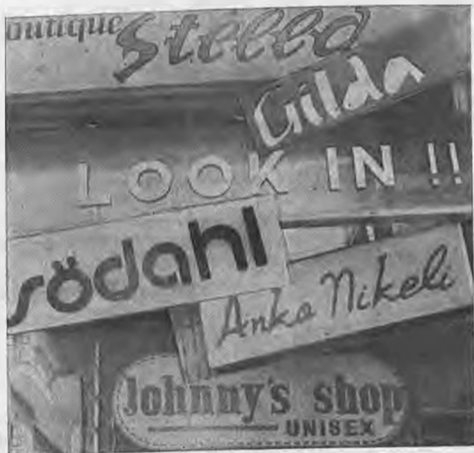
Μερικές από τις Ξενογλωσσές επιγραφές της Βέροιας που κόβει άλλο παρά Ελλάδα θυμίζον.

Έγινε στις 10 Μαΐου ο έρανος για τον αντικαρκινικό αγώνα. Στο Δήμο Βέροιας ο έρανος απέδωσε συνολικά 444.873 δρχ. έφοντας 482.190 που είχε αποδώσει πέρσι.