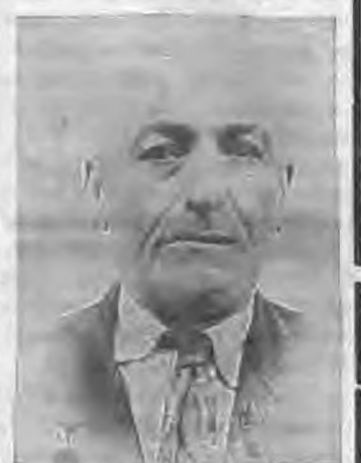
Το τέκνο Η αδελφή

Η δεξίωση θα γίνει στην αίθουσα δεξιώσεων Ι. Ναού Αγίου Ιωάννου στην Βέροια.