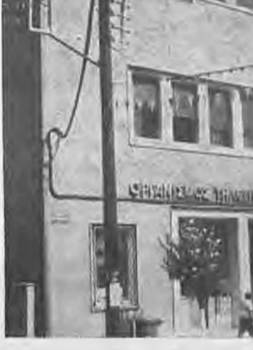
Το κτίριο του Ο.Τ.Ε. όπου στεγάζονται τα μηχανήματα του κύριου τηλεφωνικού κέντρου της Βέροιας

Καλή είναι η εντύπωση ότι ο Ο.Τ.Ε. και μας εξημερώνει και μας παιδεύει, ενώ πολλά πράγματα που έχουν σχέση με τη διαίτησή, τη δομή και τη λειτουργία του είναι άγνωστα στο ευρύ κοινό.