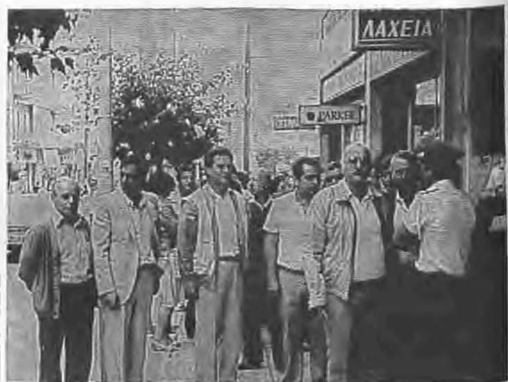
Οι απεργιοί Κοινοτικοί υπάλληλοι ηγγαίνον εν σώματι στον κ. Νομάρχη για να επιδώσουν το ψηφισμα τους.

Εικοσιτετράωρη προεδροποιητική απεργία πραγματοποιήσαν οι Κοινοτικοί υπάλληλοι του Νομού μας την Πέμπτη 20 Σεπτεμβρίου, συμμετέχοντας σε πανελλήνια κινητοποίηση του κλάδου.