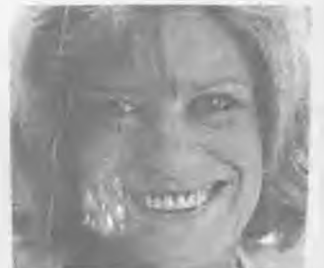
Η Υπουργός Πολιτισμού και Επιστημών κ. Μ. Μερκούρη που θα παραστεί στην πρεμιέρα του Δ.Π.Ε.ΘΕ.

Παρουσία της υπουργού πολιτισμού και επιστημών κ. Μελίνας Μερκούρη θα δοθεί από το Δημοτικό Περιφερειακό Θέατρο σήμερα το βράδυ η πρεμιέρα του έργου του Μπρέχτ « η όπερα της πεντάρας ».