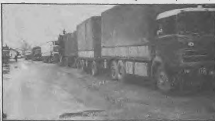
Εικόνα απ' το χώρο προ του τελωνείου. Φαίνονται οι νταλικές που σταθμεύουν πάνω στις σιδηροδρομικές γραμμές καθώς και οι λάσπες που όταν βρεχει μεταβάλλονται σε χρώμα!

Στις συγκεντρώσεις ο σχολικός Σύμβουλος των φιλολόγων κ. Αναστ. Καραδημητρίου θα αναπτύξει το θέμα: «Βασικές προϋποθέσεις για την επίτευξη του σημερινού εκπαιδευτικού Μ.Ε. στο έργο του».