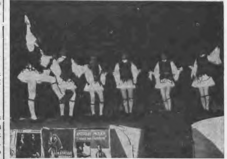
Ένα από τα έντεκα χορευτικά συγκροτήματα που πήραν μέρος στη βραδιά Δημοτικών Χορών με την οποία άρχισαν τα «Ηραθιώτικα '83» στο Στάδιο της Βεροίας.

Έντεκα συγκροτήματα του Νομού και συγκεκριμένα τα συγκροτήματα του Μορφ. Συλλόγου Ριζιμάτων, Πολυπλάτνου, της «Στέγη», «Μπαούλερ» Νάουσας, Κολλυθάς, Προμηθέα, Ποντίων Πλατύ, Ν. Λυκογιάννης, Λουτρού, «Φάρος» Πλατύ και Ευξείνου Λέσχης Βεροίας, παρουσίασαν παραδοσιακούς χορούς με