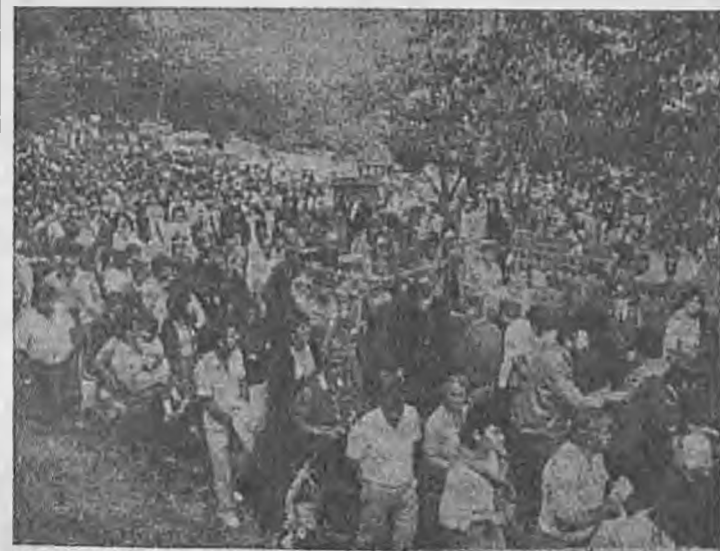
Στημιότυπο από τη λιπάνευση της θαυματουργής εικόνας της Παναγίας Σουμελά, στην Κασσανιά.

Η πυρκαϊά σβύστηκε από την Πυροσβεστική Τηφρεία Βέροιας.