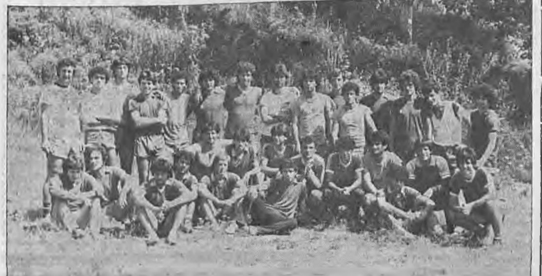
Οι ποδοσφαιριστές της «Βέροιας» ποζάρουν γι' τους αναγνώστες μας στο χώρο της προετοιμασίας τους, στην Παναγία Σουμελά.

πλήρη και σωστή ομάδα. Θα χρειαζόταν απώδημιση πίστωση χρόνου για να μπορέσουμε να φτιάξουμε την κατάλληλη ομάδα. Εγώ αλλιώς την ονειρεύομαι τη «Βέροια». Ναι γίνεται όπως ήταν παλιά, στο μεγαλύτερο ή και στις δόξες της. Λιγότερα είναι η φιλοδοξία μου. Και πιστεύω ότι θα γίνει αυτό σύντομα με τους κατάλληλους συμπαικτές και συνεργάτες, φυσικά. ΕΡ: «Ποιά η γνώμη σας για τη φετινή πορεία της «Βέροιας» με δύσκολους αντιπάλους και με μειών 5 βαθμούς;» ΑΠ: «Το φετινό πρωτάθλημα, θα πρέπει να έχουν καταλάβει και οι παίκτες και οι φιλάθλοι, παρουσιάζει μία άλλη μορφή. Θα πρέπει