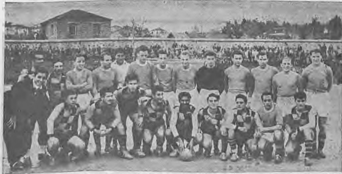
Το θρυλικό «Βέρμιον» στα επόμενα θήματά του. Στο γήπεδο της Βέροιας σε συνάντησή του με την Αούστρια τον Ιανουάριο του 1953.

Όμως γι' αυτό θα μιλήσουμε μια άλλη φορά.