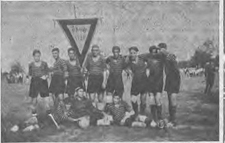
Το «Βέρμιον» στα πρώτα του θήματα.

Και ήρθε η ώρα να τερματίσει η ιστορική του πορεία το έτος 1962, όταν συγχωνεύτηκε