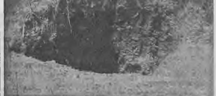
Με σκαπτικό μηχανήματα ανοίξαν οι αρχαιοκάπηλοι την τρύπα που φαίνεται στη φωτογραφία για να θρουν πολύτιμα αντικείμενα κάτω από τη μεγάλη τούμπα των Παλατισίων