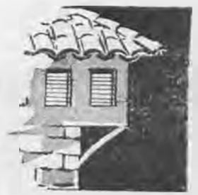
Ταχυδρομικό τέλος πληρώθηκε

Συνέταξε και προσφέρει συμπολίτης αρχιτέκτων