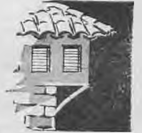
Γαχυδρομικό τέλος πληρώθηκε

Ενώ τά κόμματα έτοιμάζονται για τή μεγάλη μάχη