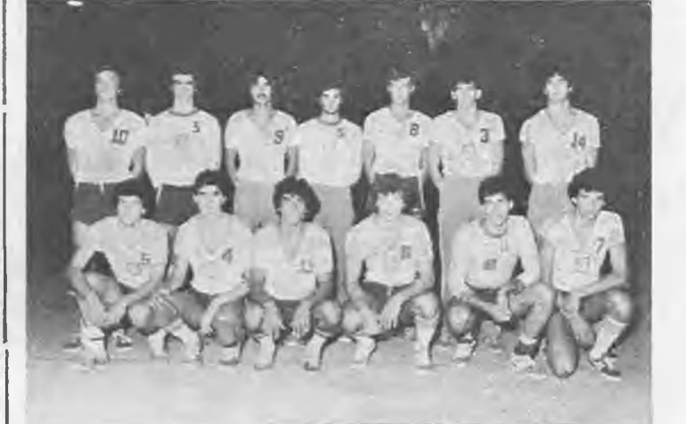
Η Εθνική ομάδα Νέων Ελλάδας που έδωσε αγώνα...