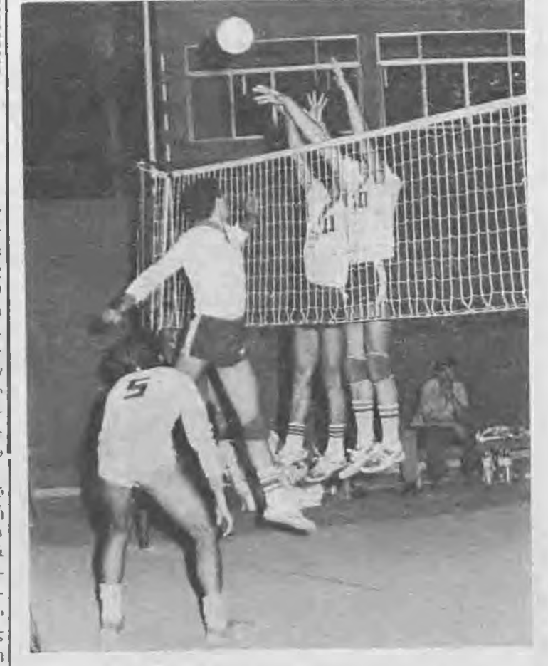
Στιγμιότυπο από τον παραπάνω αγώνα βόλλεϋ