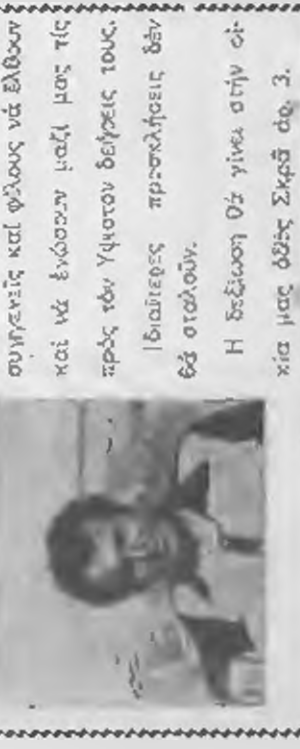
...Τά τέσσα, οι έγγονοί, τά δούλινα τά άνήφια και οι λοιποί συγγενείς

...Η δεέσηση θα γίνει στην οδόν Βεροίας αρ. 5. ΟΙ έγγονοί Τά δούλινα