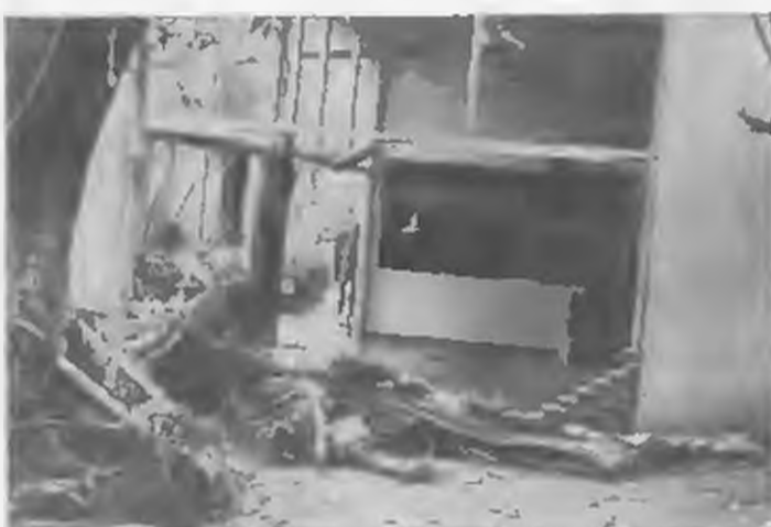
Η μονάδα του νερού κατέστρεψε άλογοχέρως τον εξωτερικό χώρο του Κέντρου της Μηχανοκίνητης και έφειδωσε τον εσωτερικό χώρο του κερσελίου παρασύροντας δ.τι. ύπηρχε μέσα.