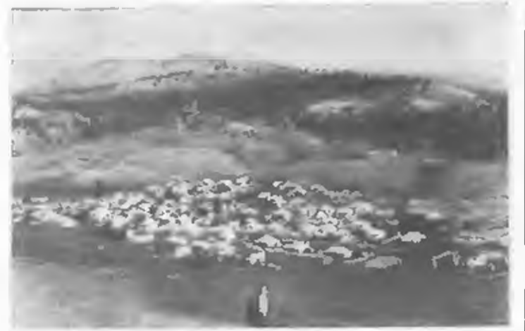
Ο παλιός οικισμός του Ξηρολεβάνου όπως ήταν πριν τον κάποιον δικαστηριακό σχεδόν οι Γερμανοί το 1944

Κι αυτό γιατί υπάρχει από τη μια μεριά το Δημόσιο και από την άλλη ο Συνεταιρισμός των αγοραστών των ή άλλου είδους δικών Συνεταιρισμών που έχουν δικαιώματα ιδιοκτησίας χωρίς αυτά να είναι ξεκαθαρισμένα.