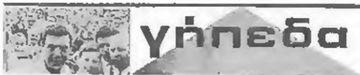
Επιβλήθηκε του Πανδραμαϊκού μέ 2-0