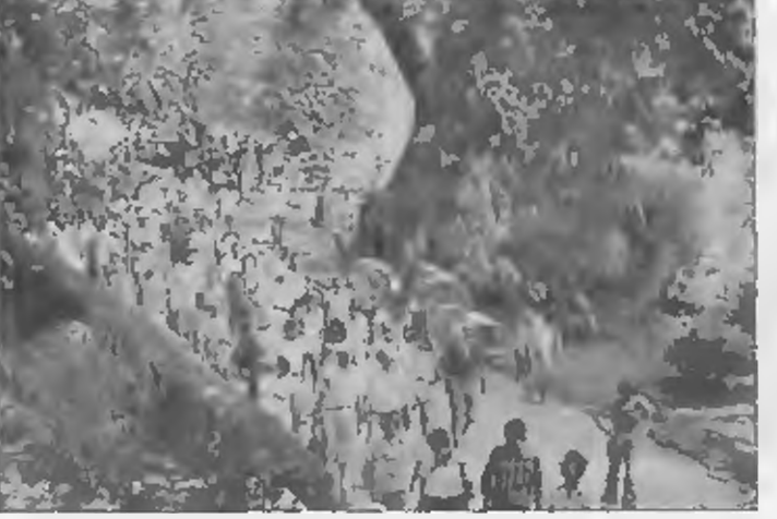
Οι τριμελής σοφοί έπισκέπτες ένώ κινετιθύνονται στο «Κύκλιον της Νουάνης» όπου γεμεύτησαν.