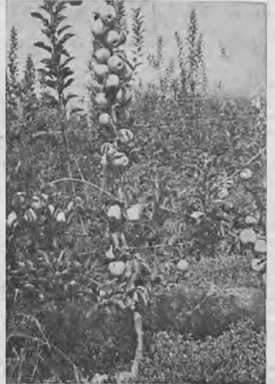
Δένδρο ήλικίας 2 ετών ποικιλίας Γκόλντεν Ντελίτσιους στο Ε.Μ. 26

Ε.Μ. 9 Είναι πολύ νάνο υποκείμενον με ριζικόν σύστημα έπιφανειακό. Προτιμά γόνιμα έλαφρά χωράφια. Έχει άνάγνη πασσάλων και σπυμάτων στηρίζων. Είναι υποκείμενον κατάλληλον για τίς ποικιλίες της ομάδος Ντελίτσιους (κόκκινες) και