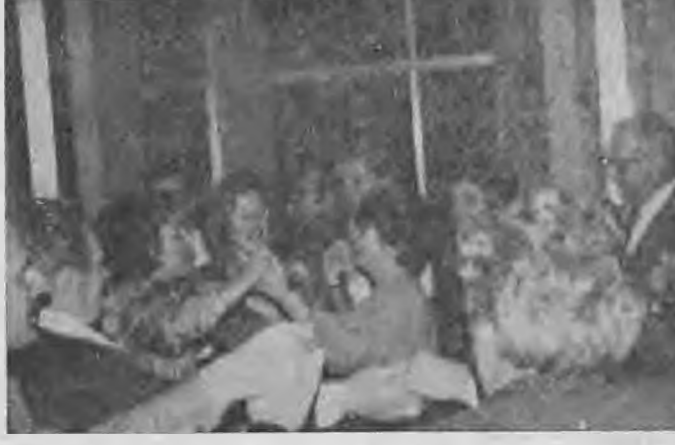
Στιγμιότυπο από τό χορό τού Πρακτορείου Καλογήρου στο «Λητώ».

Οι Δυτικομακεδόνες μέσα σε μια κατάμεστη αίθουσα γλέντησαν με τό δικό τους τρόπο και χόρεψαν τους τοπικούς τους χορούς με την άρχηγισσα τού Νίκου 'Αδαμόπουλου μέχρι τις πρωινές ώρες της Κυριακής, χωρίς καμιά διακοπή, ακόμα κι όταν, για ένα δίωρο περίπου είλες... διακοπή το ηλεκτρο-