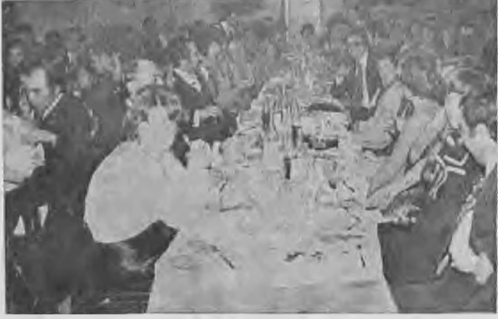
Συγμυότιστο από την χοροπερίοδα του Γ.Α.Σ. «Βέροια» που έγινε στην Έλξη την περασμένη Κυριακή.

Τα μέλη της χορωδίας, οι συγγενείς και οι φίλοι τους, πέρασαν