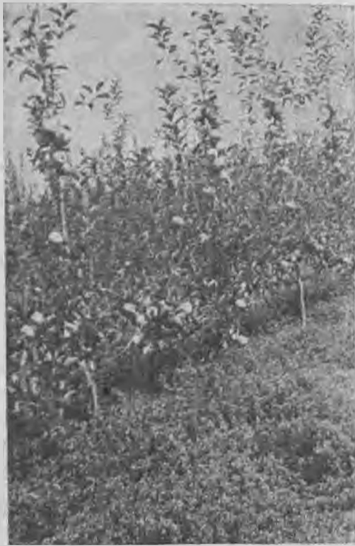
Δένδρον ηλικίας 2 ετών ποικιλίας Ρουαγιάλ Ρέντ Ντελίτσιους σε Μ.Μ. 106

ΜΟΥΤΣΟΥ. Γαπωνέζικη ποικιλία. Καρπός μεγάλου μεγέθους πράσινος, ελαστικός και χυμώδης. Δένδρον ζωηρής βλαστήσεως και καλής παραγωγής. Ωριμάζει με την Γκάλντεν