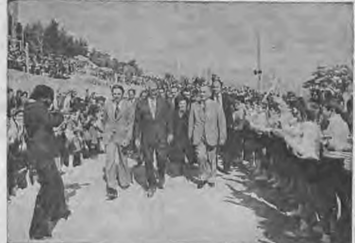
Ο Υπουργός Παιδείας κ. Ράλλης προσέρχεται στο χώρο θεμελιώσεως του 9ου Δημοτικού Σχολείου Βεροίας

Έπίσης μίλησε και ο κ. Ράλλης ο όποιος τόνισε, μεταξύ άλλων, ότι η κυβέρνηση διάθεσε το 1975 και 1976 τόσα ποσά για την ανέγερση νέων σχολικών κτιρίων όσα δεν είχαν διατεθεί κατά την προηγούμε-