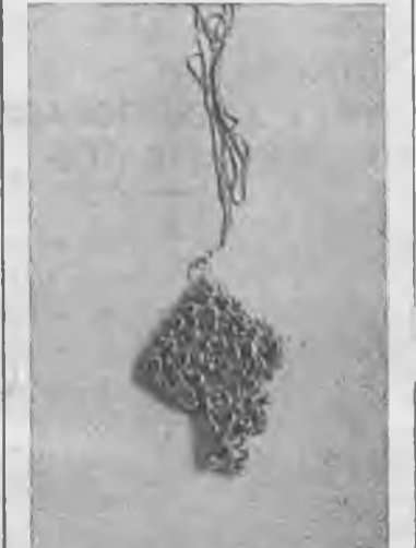
Ο Χρυσός Σταυρός (σπάνιο κειμήλιο) που βρίσκεται στην Εκκλησία του Άγ. Άντωνίου

θήκη (βάρ. 388 γραμ.) και σκαπάζεται από ένα χρυσοκέντητο πέπλο (βάρ. 20,80 γραμ.) στο όποιο εικονίζεται ή σταύρωση του Κυρίου.