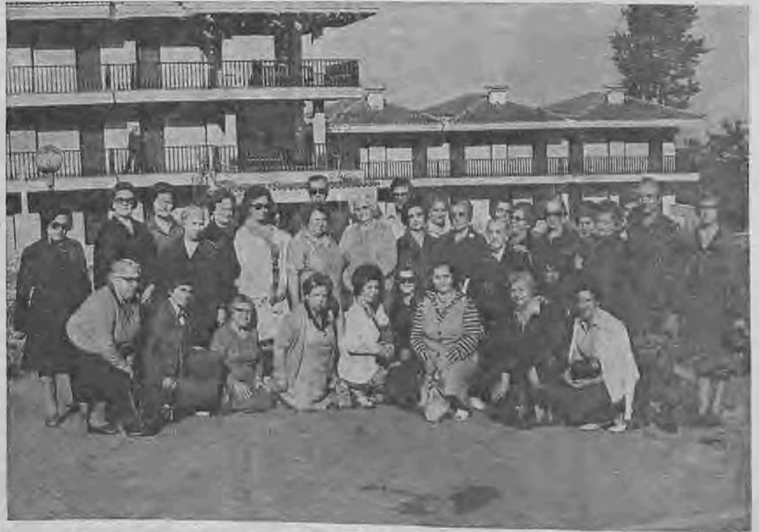
Η Φιλοπτωχος Άδελφότης Κυριών Βεροίας πραγματοποιήσε τό τριήμερο 29, 30 Σεπτεμβρίου και 1η Οκτωβρίου, εκδρομή στην Γιογγουλαβία (Μοναστήρι - Οχρίδα - Σκόπια) στην όποια πήραν μέρος 35 μέλη και φίλοι της Άδελφότητος. Την όργάνωσι της είχε αναλάβει τό Πρακτορείο Ταξιδίων της πόλεως μας ΚΑΛΟΪΗΡΟΥ. Η εκδρομή έσημείωσε έξαιρετική έπιτυχία τόσο από πλευράς οργανώσεως όσο και από πλευράς έκτελέσεως του προγράμματος. Στην φωτογραφία μας σιτημύτητα από την εκδρομή, έπιστά από τό άριστα και πολυτελές Ξενοδοχείο της Οχρίδας «ΝΤΕΖΑΡΕΤ», όπου έμειναν οι εκδρομείς.