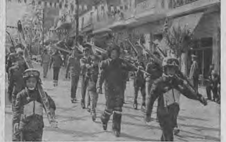
Τρία στιγμιότυπα από την παρέλασι της 16ης 'Οκτωβρίου. 'Επάνω και στη μέση ή μαθητιώσα νεολαία της πόλεως μας ενώ παρελαύνει περιήφανη μπροστά από τον κ. Νομάρχη. Κάτω, το τμήμα χιονοδρόμων του όρειβατικού Βεροίας, που έκανε με την εμφάνισί του ιδιαίτερη εντύπωσι.