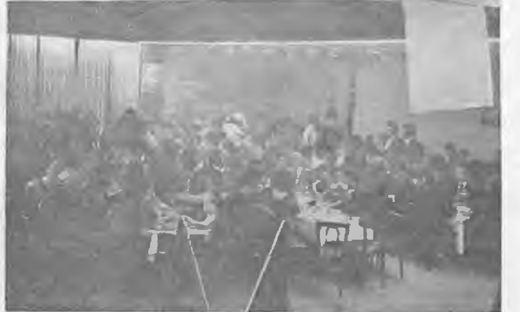
Στιγμιότυπο από το χορό του Γ.Α.Σ. Βέρροια