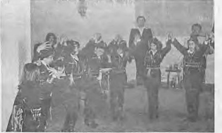
Στον χορό της Εύξεινου Λέσχης ήδαιτημη έντύπωσι έκανε ή εμφάνισι του παιδικού χορευτικού πονητικού συγκροτήματος της Λέσχης.