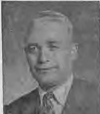
Ο νέος Πρόεδρος του Δημοτικού Συμβουλίου Βεροίας κ. Αλκ. Δελαντώνης

νες, γι' αυτό και δεν θα πρέπει οι υποψήφιοι να προταθούν από άλλους, αλλά οι ίδιοι οι ενδιαφερόμενοι να δηλώσουν έν θέλουν και έχουν τον χρόνο να αναλάβουν αυτό το θάρρος.