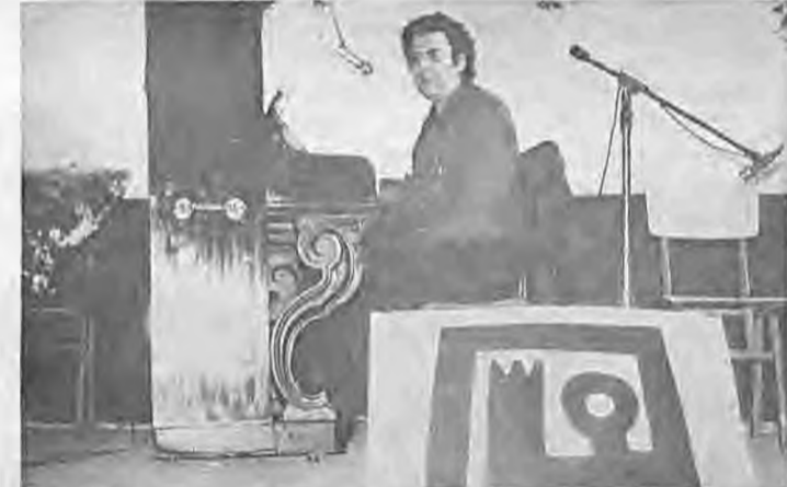
Ο Μίκης Θεοδωράκης ένθ άποδίδει μία σύνθεσί του στην εκδήλωσι που έγινε στο «Παλλάς»

δισε γνωστός του έπιτηχίς. Πρόθεσι τών όργανιστών ήταν μετά την εκδήλωσι στο θέατρο να γίνη έλεύθερη συζήτησι στο κέντρο «Αχρόπολις» κατά την διάρκειά συνεστιάσεως.