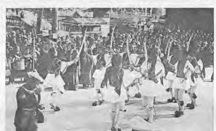
Δύο στιγμιότυπα από την παρέλασι που έγινε την Καθαρά Δευτέρα στην Μελίκη στα πλαίσια του εορτασμού του Καρναβάλου

την αωθόρητη συμμετοχή των Ναουσαίων και των έπισκεπτών, χωρίς οργανώσεσι διαγωνισμών και εμφανίσεσι επί εξέδρας χορευτικών συγκροτημάτων στην κεντρική πλατεία, όπως γίνονταν τα τελευταία χρόνια.