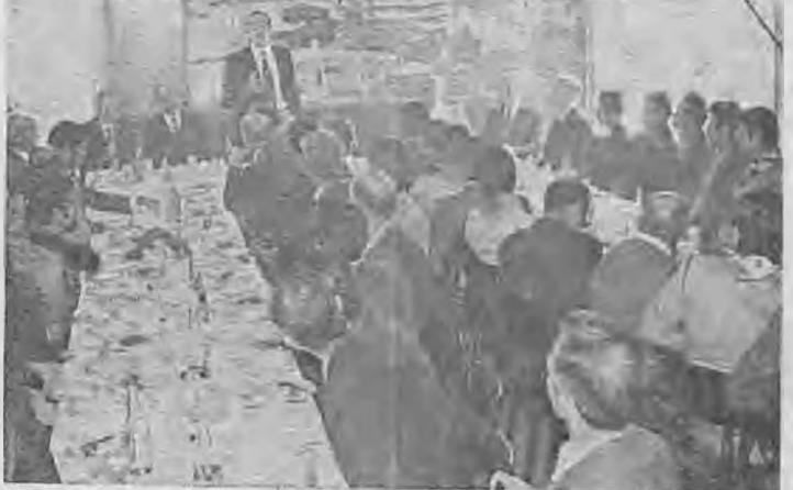
Στιγμιότυπα ἀπὸ τὸ γεῦμα ποὺ δόθηκε πρὸς τιμὴ τῶν ὁδο- καθαριστῶν ἀπὸ τὴν Τοπικὴ Ἐφορεῖα Προσκόπων Βεροίας, στὸ περίπτερο τῆς Ἐλπίδος. Ὁ κ. Νομάρχης ἐνῶ ὁμιλεῖ γιὰ τὴν σημασία καὶ τὴν ἀξία τῆς προσφορῆς τῶν ἐργατῶν καθαριότητος.