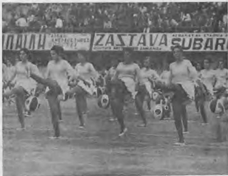
Στιγμιότυπο από την ρυθμική γυμναστική του τμήματος των μαθητριών του άνωτέρου κύκλου που έκανε ιδιαίτερη έντύπωσι.

και οι έπιδείξεις έτελεσαν με τις μαθητέες του άνωτέρου κύκλου υπό τον καθηγητή σωματικής άγωγής κ. Ε. Άνδρεανίδου.