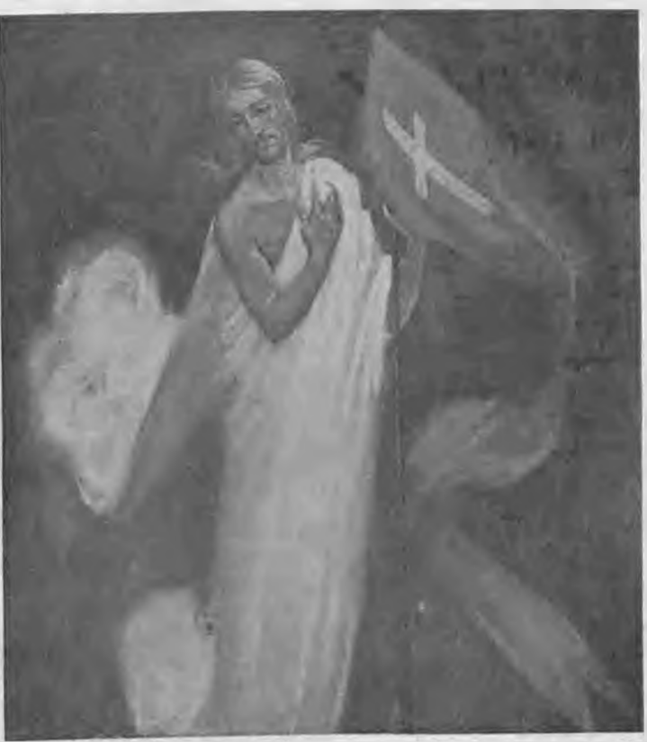
Ευχές αγάπης και ευτυχίας για την μεγάλη γιορτή