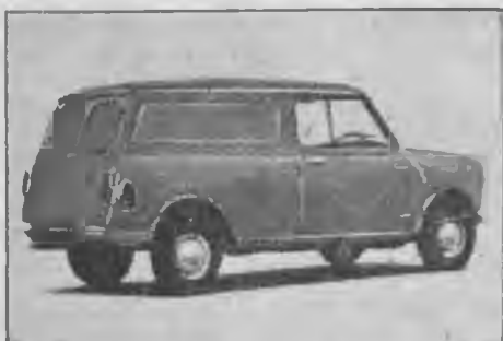
Μίνι φορτηγάκι κλειστό