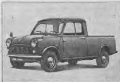
Μίνι φορτηγάκι άνοιχτό