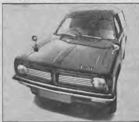
Morris Marina ήμιφορτηγό

Μιά μεγάλη σειρά μικρών μεταφορικών όχημάτων μ'ένα κοινό χαρακτηριστικό την Άγγλική παράδοσι ποιότητας. Έξασφαλισμένο service σ' όλη την Ελλάδα και ανταλλακτικά άφθονα και φθηνά. Χαμηλές τιμές άγοράς, μικρή κατανάλωσις, οικονομική συντήρησις. Άλλά ακριβή κατασκευή... Γιατί ή British Leyland δεν ήμπερι παρά νά οέθεται τό όνομά της και την μακρόχρονη ιστορία της.