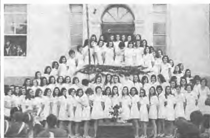
Στιγμιότυπο από την άποχωρητιστική έστια των τελειοφοιτων μαθητριών του Α' Γυμνασίου Θηλέων Βεροίας, που έπραγματοποίησθι την παραβλήσαν έβδομήμη παραμονή του 'Επιθεωρητοΰ κ. Μεταμίκη, της κ. Γυμνασιάρχου και του διδακτικού προσωπικού.