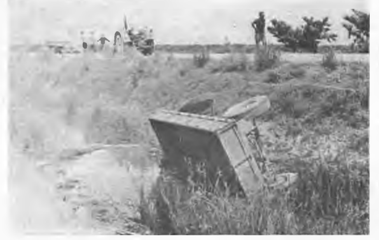
Η τραγική πλατφόρμα μέσα στο κανάλι του θανάτου.