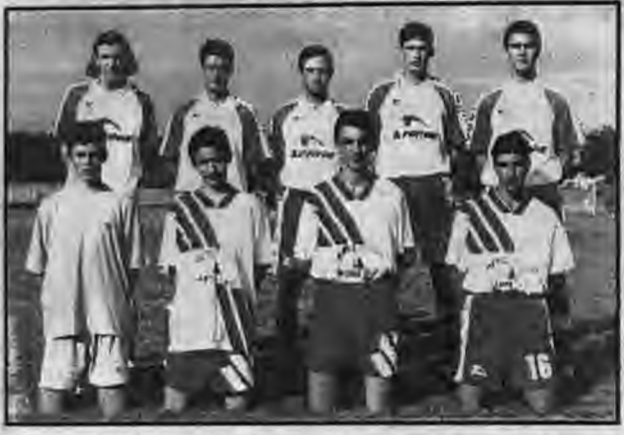
Οι νεαροί ποδοσφαιριστές που απέκτισε ο Φίλιππος Μελίκης.

ΓΙΩΡΓΟΣ δήλωσε: "Φυσικά νιώθω μεγάλη ικανοποίηση, όπως όλοι μας, επικρατεί αισιοδοξία για τις τύχες της ομάδας στο φετινό πρωτάθλημα και πιστεύω ότι μέσα από σκληρή και σωστή δουλειά, αλλά και την ανάλογη πειθαρχία, μπορούν να επιτευχθούν πολλά. Υπάρχουν αρκετά στοιχεία που μπορούν να συμβάλλουν σε μια καλή πορεία της ομάδας, είναι το όριστο κλίμα που επικρατεί, όπως και οι καινούργιες μεταγραφές που έγιναν. Κι αυτό γιατί πρόκειται για παιδιά νεαρά σε ηλικία, με πολλές ικανότητες και φιλοδοξίες για το μέλλον. Το μόνο παράπονο που έχω αφορά τον φιλόλο κόσμο της Μελικής, γνώμη μου είναι