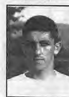
Ο Ηλιάδης μεταγράφηκε από τον Εθνικό στην ΑΕΠ.

Ο ΠΑΟΚ φέτος ξεκίνησε την προετοιμασία του νωρίτερα από κάθε άλλη ερασιτεχνική ομάδα της Ενωσής μας και μόνον το γεγονός αυτό αποδεικνύει τους υψηλούς στόχους που μπορεί να φθάσουν και μέχρι την διεκδίκηση του πρωταθλήματος.