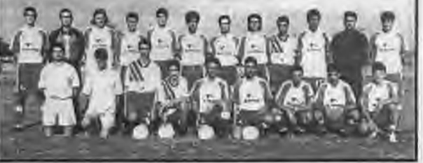
Το φετινό δυναμικό λίγο πριν την έναρξη του φιλικού αγώνα με τα Τρίκαλα.