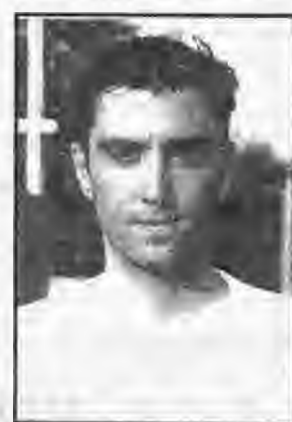
Ο Γεωργίου από τον Εθνικό Μακροχωρίου πήγε στον Αιρόντιο Διαβατό.

Νέα διοίκηση στη Δόξα Μακροχωρίου με επικε-