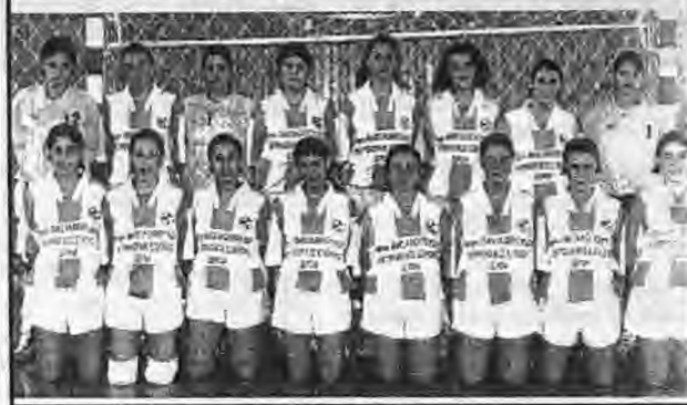
Χωρίς ουσιαστικές αλλαγές στο έμπυχο υλικό θα αγωνιστούν οι άνδρες και οι γυναίκες του Ποσειδώνα στα φετινά πρωταθλήματα της Α2 και Α1 αντιστοίχα.