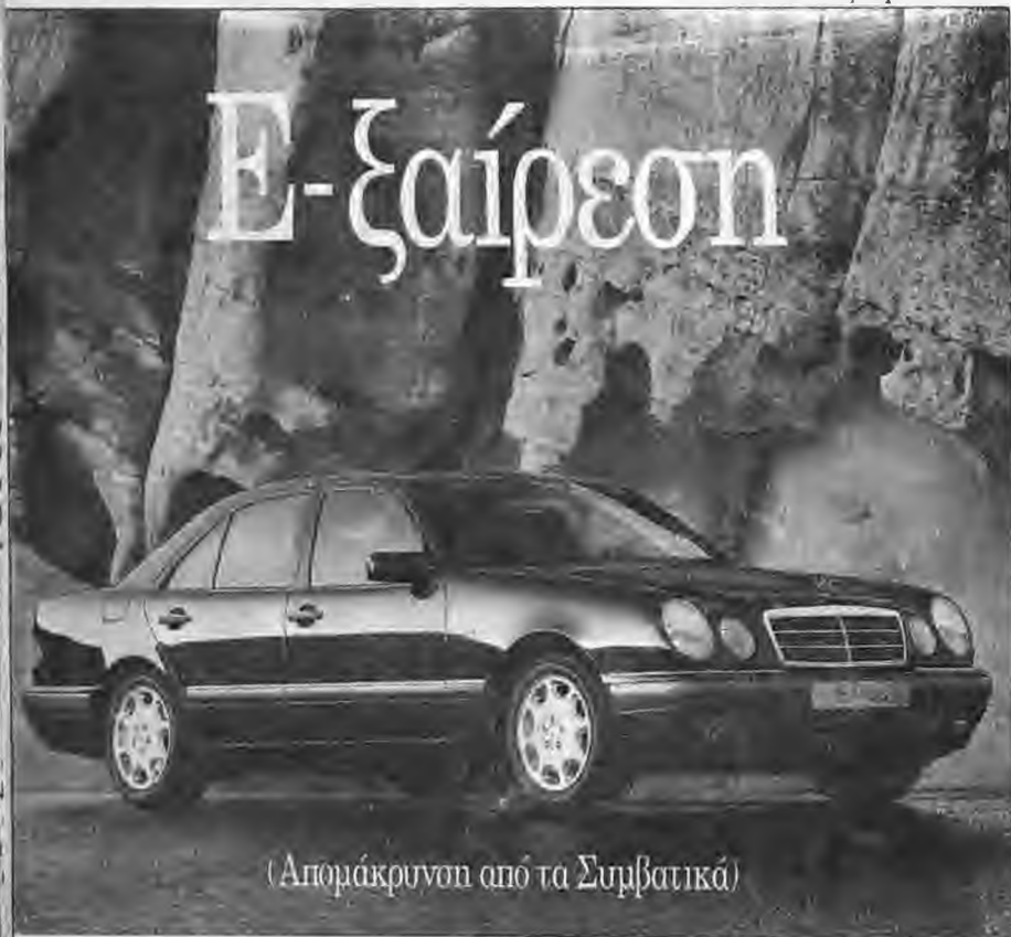
(Απομάκρυνση από τα Συμβατικά)

Ο Μάκης Τούσας που ως γνωστόν με την εφηβική ομάδα του ΒΑΟ κατέκτησε τον πανελλήνιο τίτλο και είναι από τους νέους ανερχόμενους προπονητές μπάσκετ, έχει συμβόλαιο ενός χρόνου με την προσφυγική ομάδα και αισιοδοξεί να κάνει μια νέα καριέρα. Η "Κ" του εύχεται κάθε επιτυχία.