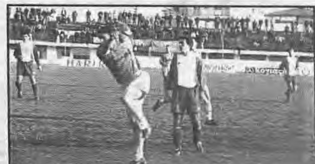
Απυκνοι στάθηκαν για άλλη μια φορά εκτός έδρας οι ποδοσφαιριστές των Ποντιών. Στην φωτο ο Φουρκιώτης σε παλαιότερο αγώνα.