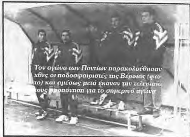
Τον αγώνα των Ποντίων παρακολούθησαν χθες οι ποδοσφαιριστές της Βεροίας (φωτο) και αμέσως μετά έκαναν την τελευταία τους προπόνηση για το σημερινό αγώνα

ΕΠΣ ΗΜΑΘΙΑΣ ΕΠΙΚΡΑΤΗΣΑΝ ΤΑ... ΦΑΒΟΡΙ Η έκπληξη στη Βεργίνα