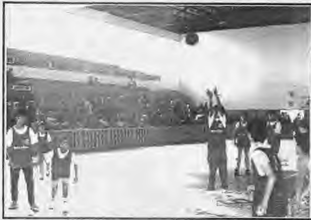
Φάση από παλαιότερο αγώνα της Ακαδημίας.

Στο άλλο παιχνίδι όπου μετείχαν παίκτες που γεννήθηκαν το