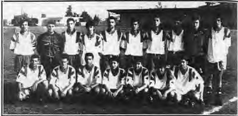
Ο Εθνικός Μ. διατηρήθηκε στην κορυφή του βαθμολογικού πίνακα, ύστερα από τη νίκη του μέσα στο Λιανοβέρι 4-0.

Λευκάδια, στο οποίο τελικά έστω και δύσκολα επικράτησαν οι γηπεδούχοι, οι οποίοι είχαν μια ελαφρά υπεροχή. Σύμφωνα με την παραδοχή των γηπεδούχων, η ομάδα της Ακαδημίας Μ ήταν η καλύτερη που πέρασε την φετινή περίοδο από τα Λευκάδια.