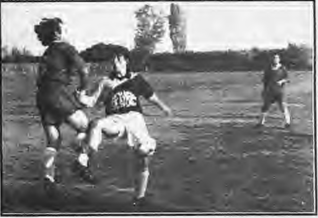
Φάση από τον αγώνα του α' γύρου, μεταξύ Νικομήδειας και Νησελίου. Χθες οι δυο ομάδες νίκησαν και μάλιστα εκτός έδρας.

Η ΜΟΡΦΗ ΤΟΥ ΑΓΩΝΑ: Ένα πολύ ομορφο παιχνίδι έγινε το Σάββατο στα