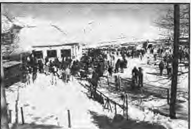
Τέτοιες καλές στιγμές ακόμη δεν γνώρισε φέτος τα Σέλι, αφού χιόνι έχει μόνον στην περιοχή Αρσουύμπασσι.

Εμείς ευχόμαστε στους φίλους μαγαζάτορες του ωραιότερου ορεινού χωριού της Ελλάδος να ζήσουν τέτοιες στιγμές, έστω και μέσα στον Φεβρουάριο.