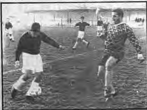
Φάση από τον αγώνα της Ακαδημίας Μακροχωρίου με το Ροδοχώρι.

ΕΠΣ ΗΜΑΘΙΑΣ ΕΠΙΚΡΑΤΗΣΑΝ ΤΑ... ΦΑΒΟΡΙ Η έκπληξη στη Βεργίνα