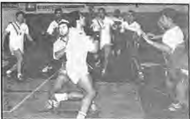
Φάση από παλαιότερο παιχνίδι της ΓΕΒ, η οποία χθες υποχρεώθηκε σε ήττα στην Κατερίνη 23-22