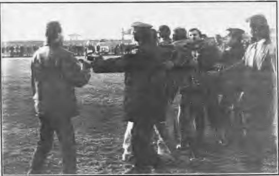
ΧΑΡΙΕΣΣΑ-ΕΛΠΙΔΑ Β. 4-0. Ντέρμπι χωρίς αφιμαχίες δεν νομίζει. Ετσι και στην Χαριεσσα ευτυχώς μια μόνον φορά κόντεψα να έλθουν στα χέρια οι αντίπαλοι. Η επέμβαση των ψευκραιμότερων και της αστυνομίας, σίγουρα έπαιξε τον ρόλο της.