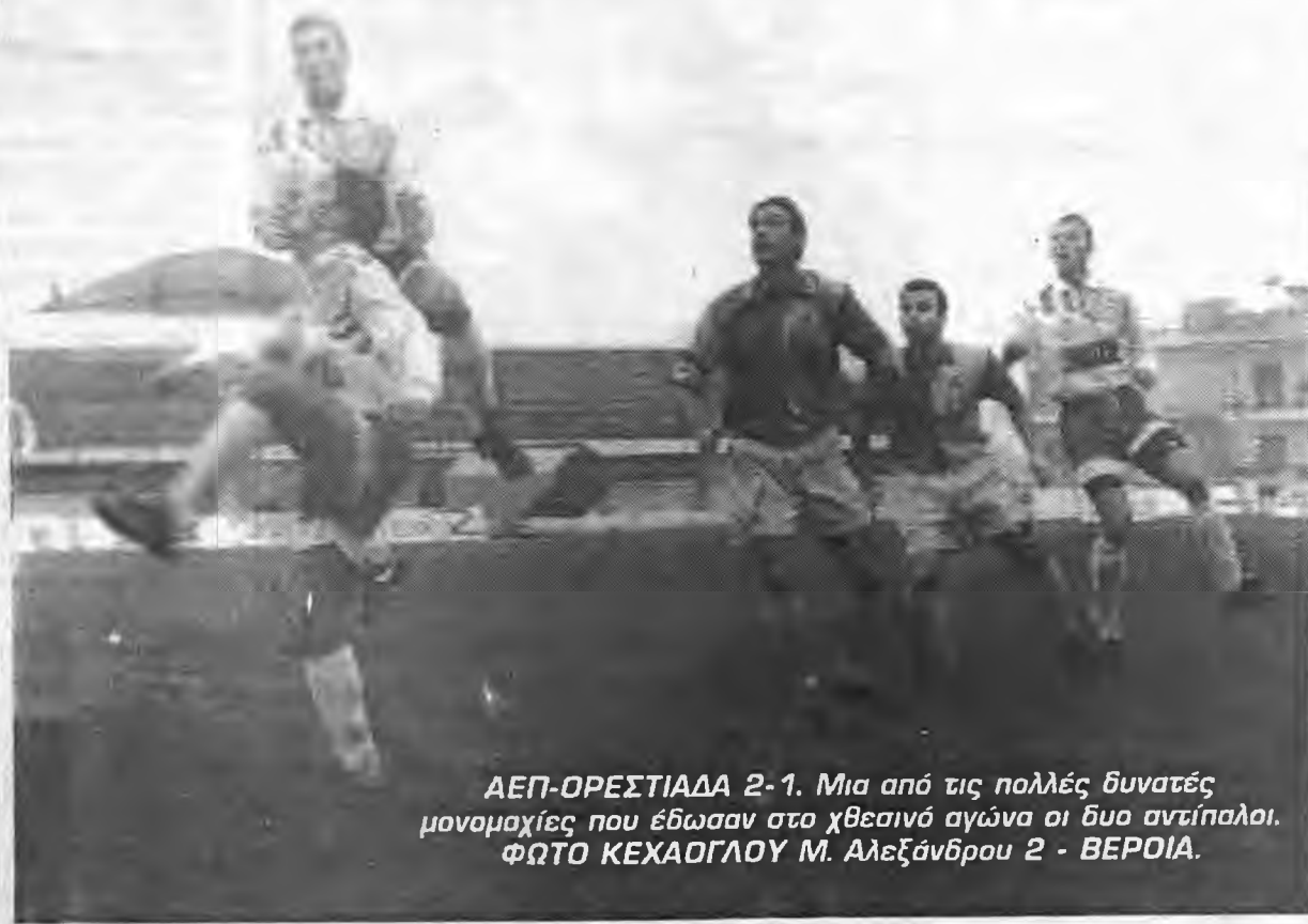
ΑΕΠ-ΟΡΕΣΤΙΑΔΑ 2-1. Μια από τις πολλές δυνατές μονομαχίες που έδωσαν στο χθεσινό αγώνα οι δυο αντίπαλοι. ΦΩΤΟ ΚΕΧΑΔΓΛΟΥ Μ. Αλεξάνδρου 2 - ΒΕΡΟΙΑ.