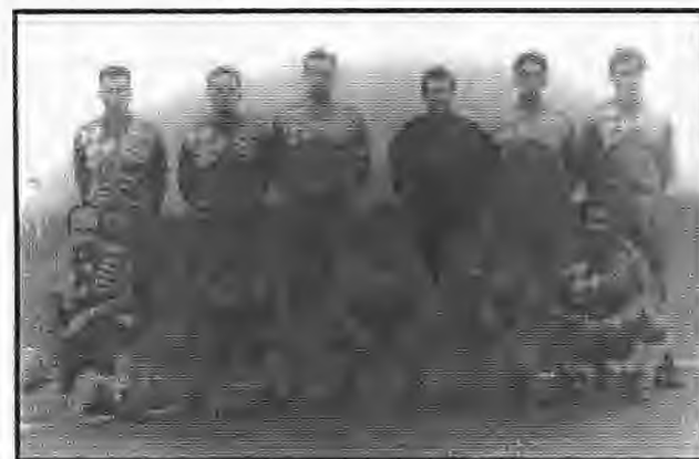
Ο Μ. Αλέξανδρος Αγ. Μαρinas όπως κατατάχθηκε στον προχθεσινό του αγώνα με τον ΠΑΟ Παλατιτσίων, από τον οποίο και ηττήθηκε με 5-2.

Για την πισιότητα και την καθαιοθνοία κάθε τοπογραφικη εργασία