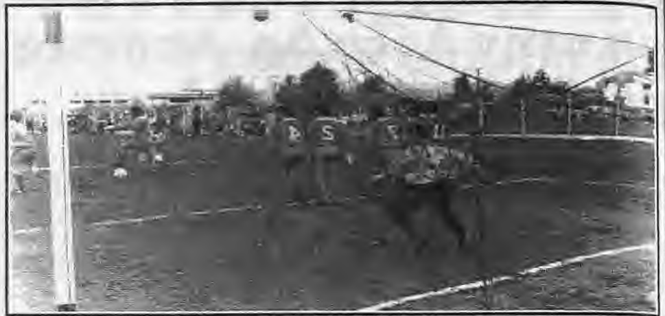
ΑΓ. ΜΑΡΙΝΑ - ΣΤΕΝΗΜΑΧΟΣ 2-1. Το ανθρώπινο τοίχος των παικτών της Στενημάχου δεν είναι αρκετό να αποσοβήσει το δεύτερο τέρμα των γηπεδούχων, όπως το συνέλαβε ο φακός της "Κ".