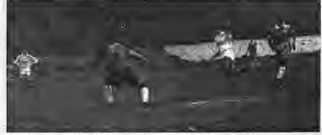
ΠΛΑΤΥ - ΑΛΕΞΑΝΔΡΕΙΑ 1-0. Ο Ανδρονικίδης με έξοχη προσωπική ενέργεια και ψύχραιμο πλάσε σημειώνει το γκολ που έκρινε τον αγώνα, παρά την έξοδο του Γιώργου Παρταλίδη.