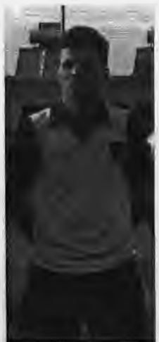
Ο Πετρίδης που πέτυχε τα δύο τέρματα της Δόξας Μακροχωρίου στο χθεσινό παιχνίδι με τον Εθνικό Γιαννιτών.