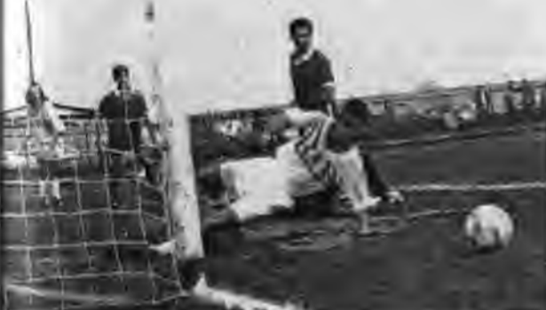
ΤΡΙΚΑΛΑ - ΕΠΙΣΚΟΠΗ 2-2. Ο μη διακρινόμενος Καϊσιός έζει οσοίνορε και οι Αδαρίδας (Επισκοπής), Γιάντζης (Τρικάλων) μάταια προσπαθούν να βρουν: των μιάλα η οσοία φαίγει όουτ.

Σκόρερς: 4' Ιωαννίδης 0-1, 6' Τερζίδης 1-1, 31' Μητσόπουλος 2-1, 60' Κουρούς 2-2. Διατητής: Τσανασιδής (άριστος). Επόπτες: Πισσάς - Παλατζίδης (άριστοι). ΣΥΝΘΕΣΕΙΣ: