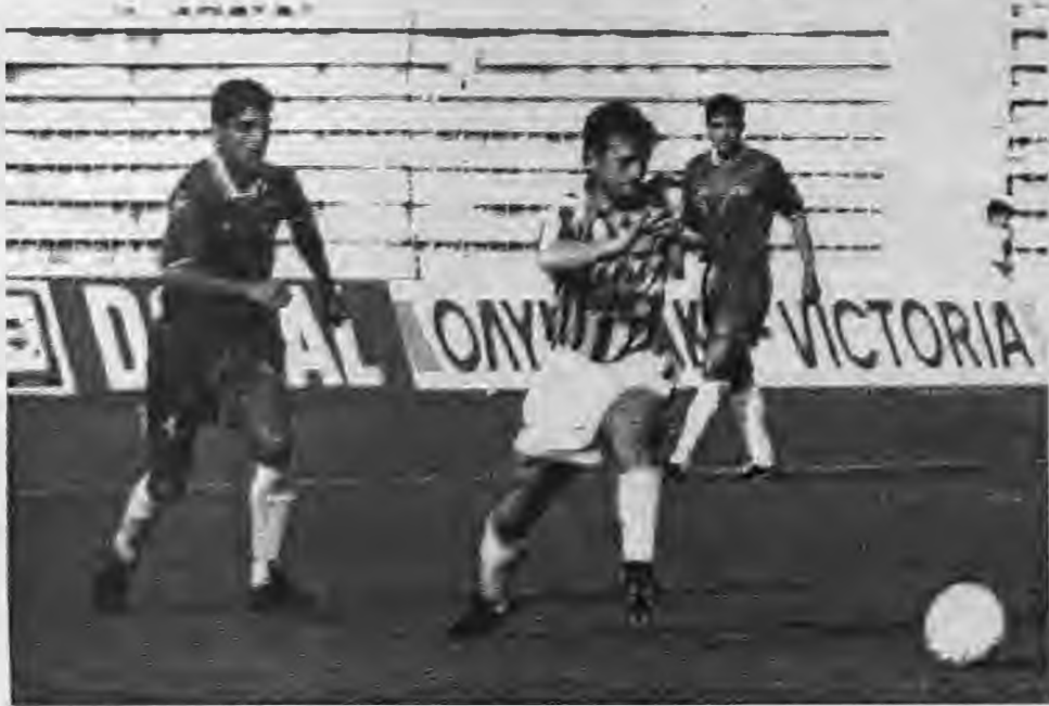
ΗΡΑΚΛΗΣ - ΝΑΟΥΣΑ 4-2

Η Νάουσα έκανε πολύ καλή εμφάνιση παρ' ότι Αλεξιάδης και Τρούπκος, Ζίφ-