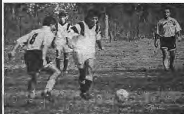
Φάση από τον χθεσινό αγώνα στην Επισκοπή μεταξύ Ξεχασμένης - Καβασιλών.