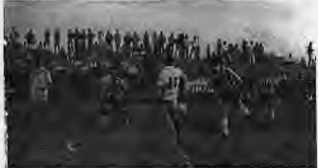
ΑΓΚΑΘΙΑ - ΠΑΙΚΟ 3-2: Φάση από το νικηφόρο αγώνα της Νίκης Αγκαθιάς με αντίπαλο το Πάικο Γουμένισσας. Διακρίνονται οι Σαρμάρας, Σαρμάρας και Ελιουακίδης.

Όπως πληροφορηθήκαμε την περασμένη βδομάδα υπέβαλε την παραίτησή του από τον "πάγκο" της Νίκης Αγκαθιάς ο προπονητής της Βαγγελής