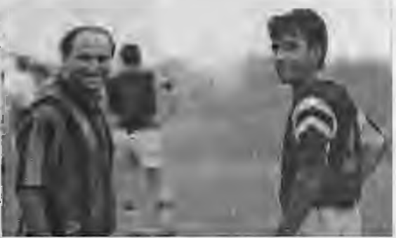
Τι μπορεί αλήθεια να ελπίζει, η ΕΛΠΙΔΑ Βέροιας από τον κύριο αριστερά;

σχέσεις που έχουν δημιουργηθεί σήμερα μεταξύ του δεύτερου και της ομάδας στην οποία ανήκει.