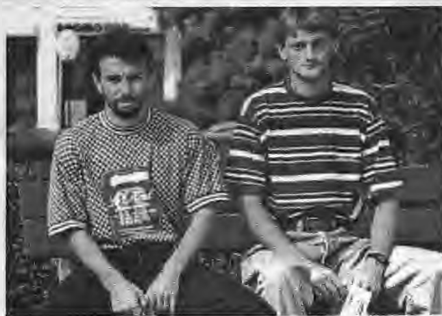
Αισθάνονται αμίκινα στην φωτογράφιση οι δύο άσοι της Βέροιας, αλλά για την "ΚΕΡΚΙΔΑ" και τον κόσμο της ομάδας, είναι διατεθημένοι να υπομένουν πολλά.

Σε μια πολιτικοαθλητική συνέντευξη μιλούν στην "ΚΕΡΚΙΔΑ" οι Τρίβιτες - Πέτκοβιτες