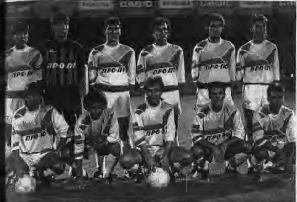
Η μεγαλύτερη επιτυχία της Αλεξάνδρειας είναι αναμφισβήτητα το ισόπαλο αποτέλεσμα που πήρε σε αγώνα Κυπέλλου μέσα στο στάδιο Νίκος Γκούμας από την ΑΕΚ, από όπου και το φωτογραφικό στιγμιότυπό μας.

Αλεξάνδρεια, τρίτη πόλη του νομού Βόρειας, αποτελεί το εμπορικό κέντρο της πόλης με μεγάλη σε έκταση και πληθυσμό περιοχή -το Ρουμλιόκι όπως παλαιότερα ήταν γνωστή- που περιλαμβάνει περίπου κοινόκτητες.