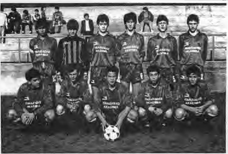
Η Παλασιδής Ακαδημία που αποτελεί το φυτώριο του Αχιλλέα και ιδρύθηκε το 1990.

Πρώτος πρόεδρος και από τα ιδρυτικά μέλη του Αχιλλέα, είναι ο Παπαδόπουλος Αντώνης, που σήμερα είναι 90 ετών.