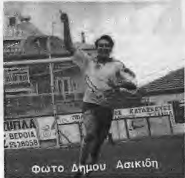
ΑΕΠ - ΧΑΡΑΥΓΙΑΚΟΣ 4-1

Προς στιγμή και μέχρι τα πρώτα λεπτά του δεύτερου ημιχρόνου επηρεασμένη από το ρευστό 2-1 εμφανίστη-