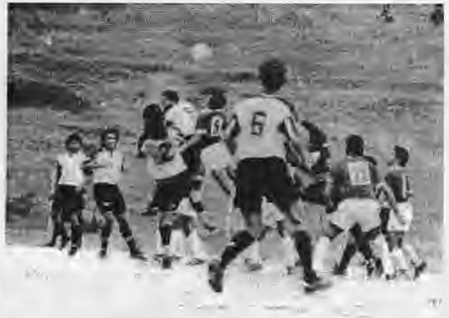
ΒΕΡΓΙΝΑ - ΑΞΟΣ 0-2 Συνωστισμός μπροστά στην εστία της Νίκης Αξού με τις... δύο ενδεκάδες να διεκδικούν τη μπάλα.