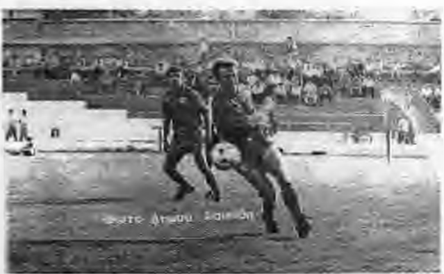
ΒΕΡΟΙΑ - ΠΙΕΡΙΚΟΣ 1-0

69' Αριστουργηματική εκτέλεση... φούλ του Πάτε έξω από την περιοχή