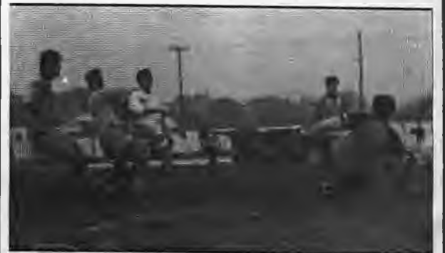
ΕΘΝΙΚΟΣ ΜΑΚΡΟΧΩΡΙΟΥ-ΚΑΜΠΟΧΩΡΙ 3-2.

ΣΥΝΤΡΙΒΗ ΤΗΣ ΕΠΙΣΚΟΠΗΣ Πρωτιά του Κλειδιού