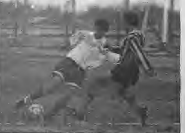
ΠΑΛΑΤΙΤΣΙΑ - ΝΙΚΟΜΗΔΕΙΑ 2-1 Το πείσμα και το πάθος για την νίκη ήταν τα κύρια γνωρίσματα της συνάντησης αυτής, κάτι άλλωστε που φαίνεται και στο φωτογραφία μας.

Μορφή του αγώνα: Παρά το γεγονός ότι η γηπεδούχος ομάδα δέχτηκε πρώτη τέρμα, κατάφερε να κρατήσει την ψυχραιμία της, να ανασυνταχτεί και να πετύχει την πρώτη της νίκη στο πρωτάθλημα, απέναντι σε μία ομάδα που αποτελείται από νεαρούς κυρίως παίκτες. Η νίκη αυτή ήταν τονωτική για τους Παλατιτώτες που δικαιούνται πλέον να ελπίζουν σε καλύτερες μέρες.