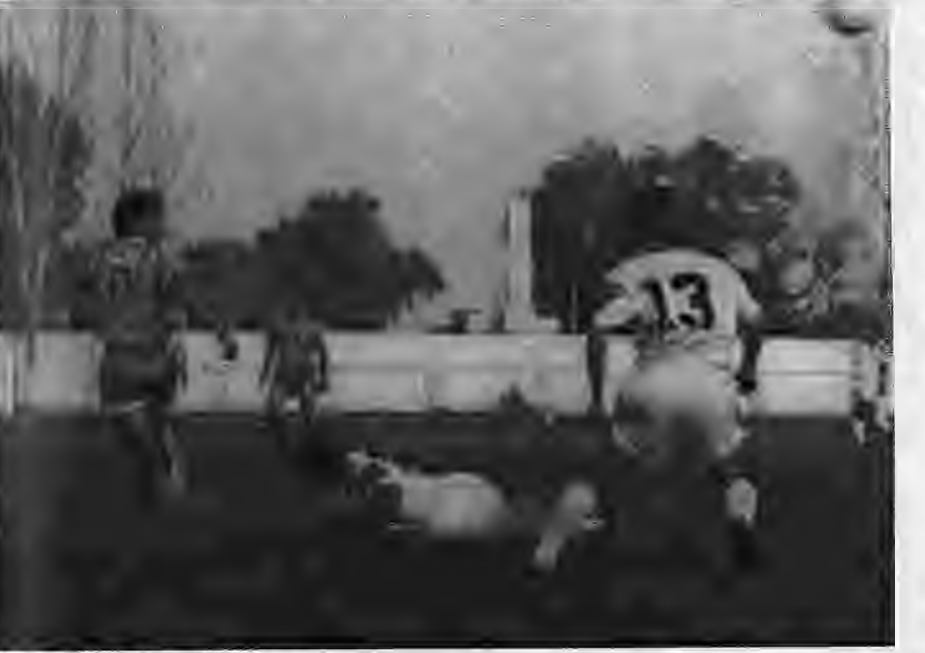
ΑΞΙΟΥΠΟΛΗ - ΜΑΚΡΟΧΩΡΙ 3-1. Από τις πολλές σκληρές μονομαχίες που έγιναν μεταξύ των ποδοσφαιριστών των δύο ομάδων.

Δόξα χθες στην Αξιούπολη έχασε μοναδική ευκαιρία πάρει ένα θετικό εκτός έ-