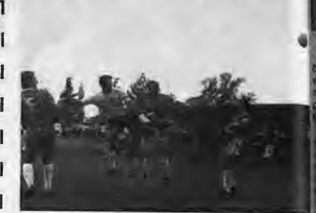
ΚΟΥΛΟΥΡΑ - ΑΧΙΛΛΕΑΣ 2-1 Ο Ιορδάνης Παπαδόπουλος με έξοχη κεφαλιά που κερδίζει από τον Πολύζο πετυχαίνει το νικητήριο τέρμα της ομάδας η Παρακολουθούν οι Ιωαννίδης (6), Καζεπιδης, Βάνης.