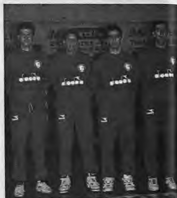
...Ότι όμως και οι τρεις νεαροί της νέας φουρνιάς παρά το 31 πόντους που πήξαν.

Όμως για να κερδίσει ένα παιχνίδι πρέπει πάνω απ' ό-