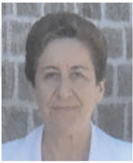
Γράφει η Κωνσταντία Ιωσηφίδου