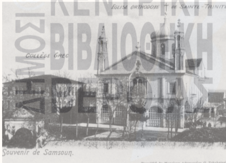
Ο Μητροπ.Ναός της Αγίας Τριάδος σε ταχ. δελτάριο.

καταστρέφεται. Έκανε ό,τι ήταν δυνατό για να αποκαταστήσει εν μέρει την καταστροφή χαρίζοντας την ελευθερία της και επεκτείνοντας την επικράτειά της. Αργότερα, το 64 π.Χ. η πόλη παραχωρήθηκε από τον Πομπήιο στη Βιθυνία και ενσωματώθηκε στη νεοσύστατη επαρχία Πόντου-Βιθυνίας.