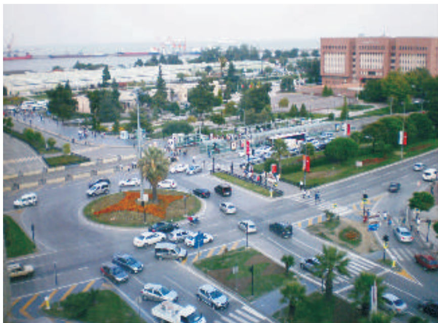
Κεντρική πλατεία Σαμψούντας.

Το χειμώνα του 48/47 π.Χ. ο Φαρνάκης Β', γιος του Μιθριδάτη, επωφελούμενος από τον εμφύλιο πόλεμο μεταξύ Πομπήιου και Καίσαρος, κατέβηκε από τον Κιμμέριο Βόσπορο και την κατέλαβε μετά από μακρά πολιορκία. Την λεηλάτησε και σκότωσε όλους τους νέους κατοίκους της. Μετά τη μάχη στα Ζήλα (48 π.Χ.) και την ήττα του Φαρνάκη, ο Καίσαρ απέδωσε στην Αμισό την ελευθερία της. Λίγο αργότερα, το 39 π.Χ., ο Μάρκος Αντώνιος, όταν ανέλαβε τη διοίκηση της Ασίας, την παραχώρησε στον Πολέμωνα Α΄ και τη χήρα του Πυθοδορίδα στο νεοσύστατο