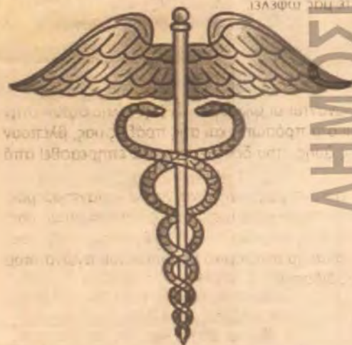
Κηρύκειο του Ερμή

Ο μύθος για το πώς προήλθε το κηρύκειο αναφέρει ότι κάποτε ο Ερμής διαχώρισε με το ραβδί του δύο φίδια που πάλευαν άγρια μεταξύ τους. Από τότε λοιπόν το ραβδί με τα δυο φίδια, στολισμένο και με τις φτερούγες του «φτεροπόδαρου» θεού Ερμή, έγινε σύμβολο της ομόνοιας και της καταπαύσεως της διχόνοιας (πρβλ. τον παρόμοιο μύθο του μάντη Τειρεσία). Στην αρχαία Ελλάδα το χρησιμοποιούσαν ως διακριτικό έμβλημα οι πρέσβεις και οι κήρυκες, ώστε να προστατεύονται από εχθρικές προς αυτούς ενέργειες της εξουσίας. Στην ύστερη αρχαιότητα το κηρύκειο άρχισε να συμβολίζει το εμπόριο, ενώ σήμερα, ιδίως στη Βόρεια Αμερική, χρησιμοποιείται ως σύμβολο της Ιατρικής, από σύγχυση με το παραδοσιακό ιατρικό σύμβολο, τη Ράβδο του Ασκληπιού, η οποία φέρει μόνο ένα φίδι και όχι φτερούγες.