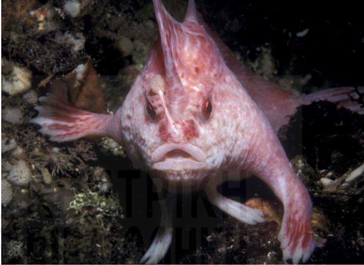
Pink Handfish. Είναι 10 εκ. και βρέθηκε στην Τασμανία