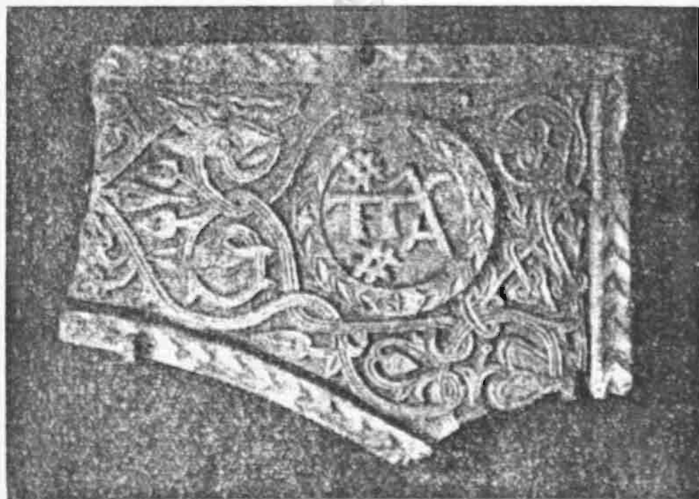
Εἰκ. 8. Μονόγραμμα Παλαιολόγων ἐπὶ ἑτέρου τόξου τοῦ αὐτοῦ κιβωρίου.

Ἡμισὺ δεξιὸν τοῦ περιτόξου ἑνὸς κιβωρίου.