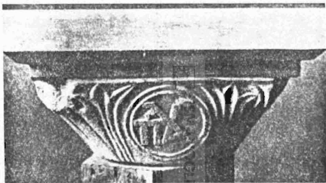
Εἰκ. 4. Μία τῶν ὄψεων κιονοκράνου μετὰ μονογράμματος τῶν Παλαιολόγων.

Τὸ ἐν λόγῳ ἀνάγλυφον θὰ ἔχη ἀναμφιβόλως ἀνευρεθῆ κατὰ τὰς ἀνασκαφὰς τὰς ὁποίας ἐξετέλεσε τὸ Σῶμα τῆς Γαλλικῆς Κατοχῆς εἰς τὴν περιοχὴν τοῦ Ἐκρωτηρίου τῶν Σουλτανικῶν Ἀνακτόρων, ἀκριβῶς εἰς τὴν θέσιν τοῦ Ἀνακτόρου Κωνσταντίνου τοῦ Μονομάχου, καὶ τῆς Μονῆς Ἁγίου Γεωργίου τῶν Μαγγάνων. Εἰς τὴν ἰδίαν θέσιν ἀνευρέθη καὶ τὸ μέγα μαρμάρινον ἀνάγλυ-