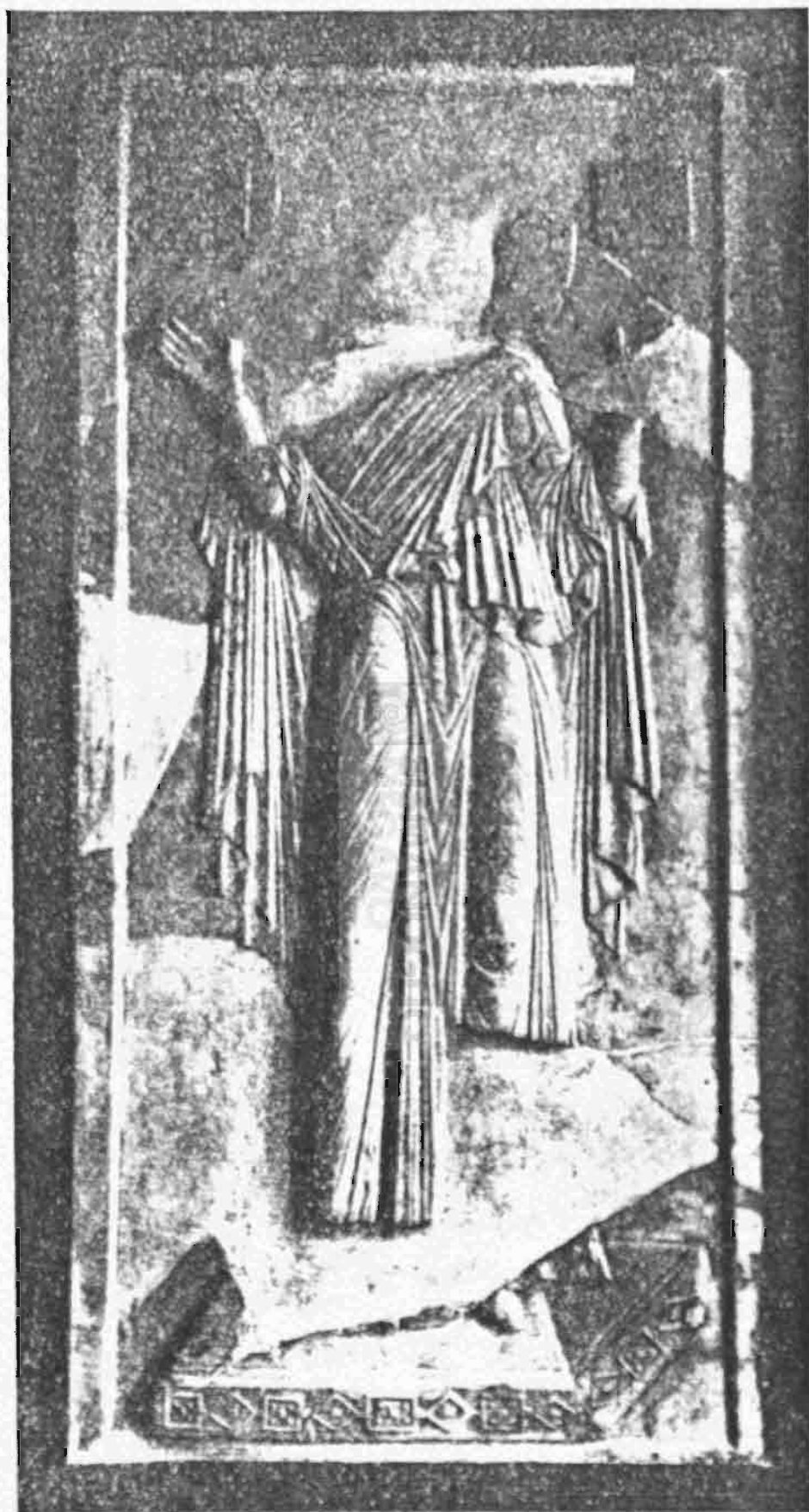
Είχ. 3. 'Ανάγλυφον Παναγίας δεομένης τοῦ Μουσειου Κωνσταντινουπόλεως.