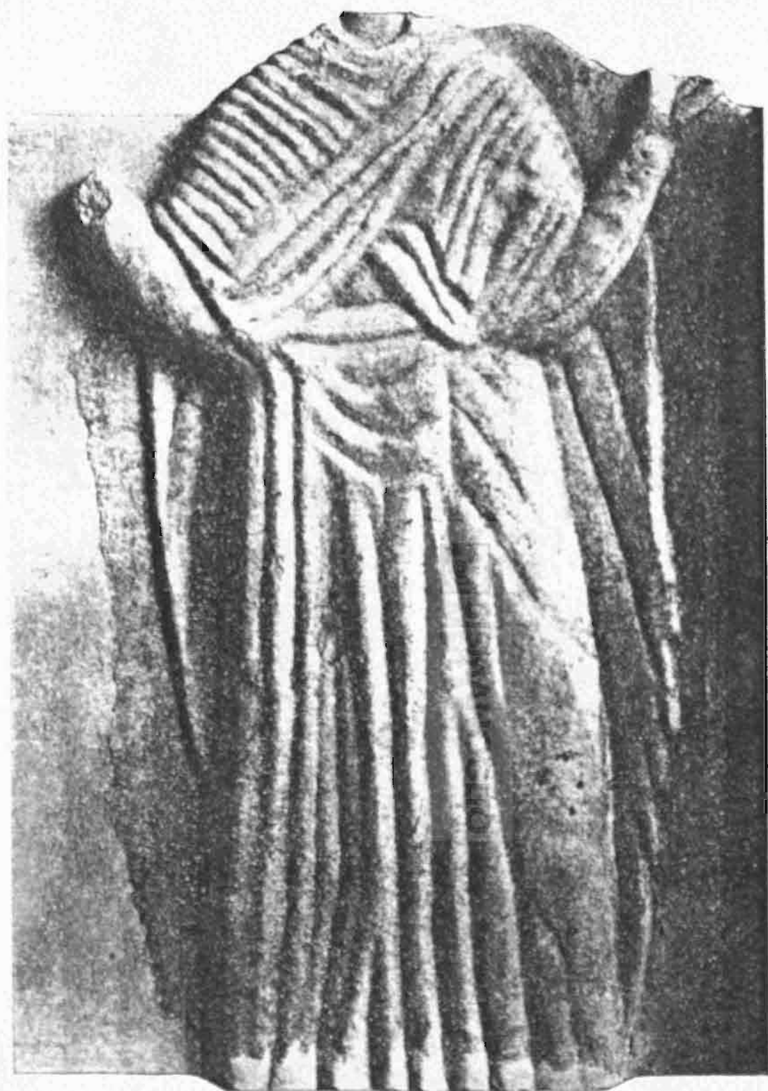
Εἰκ. 2. Ὁπισθία ὄψις ἀναγλύφου Παναγίας δεομένης.

Τὸ ἀνάγλυφόν μας, συγκρινόμενον πρὸς τὰς πολυαρίθμους ἤδη γνωστὰς ἀναπαραστάσεις τῆς δεομένης Θεοτόκου 1 , δὲν παρουσιάζει ἀξιοσημειώτους