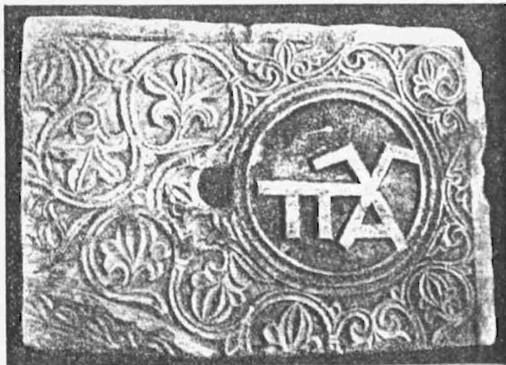
Εἰκ. 7. Μονόγραμμα Παλαιολόγων ἐπὶ τοῦ δεξιοῦ τόξου κιβωρίου.