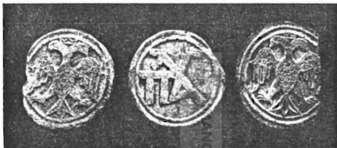
Εἰκ. 6. Μετάλλια ἐκ τῶν ὄψεων τοῦ κιονοκράνου τῶν εἰκ. 4 καὶ 5.

Ἐδῶ ἐπίσης τὸ ὄνομα τοῦ Αὐτοκράτορος, τὸ ὁποῖον θὰ ἀνεγράφετο ἐν τῷ ἀριστερῷ ἀντιστοίχῳ μεταλλίῳ, ἔλλείπει.