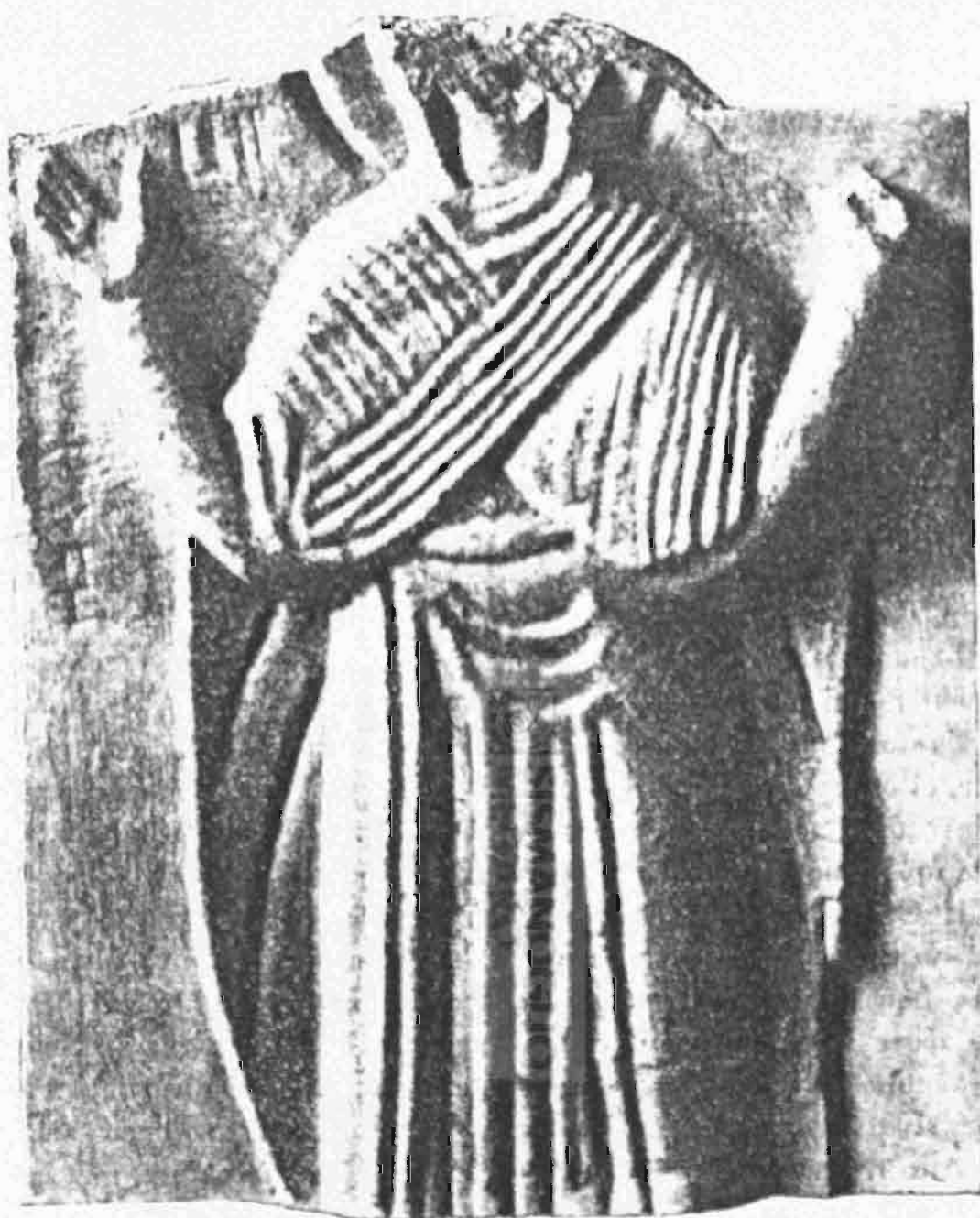
Εἰκ. 1. Προσθία ὄψις ἀναγλύφου Παναγίας δεομένης.

Ἡ πλάξ ἐπλαισιοῦτο ἐκ τῆς δεξιᾶς πλευρᾶς ὑπὸ γυμνοῦ προέχοντος περιζώματος, τοῦ ὁποίου διατηρεῖται ἐν τμῆμα. Ἐπὶ τῆς πλευρᾶς ταύτης ἀπεικονίζεται ὁμοίως ἢ ἰδίᾳ παράστασις, ἐν τῇ ἰδίᾳ στάσει, καὶ φέρουσα ὁμοιον ἔνδυμα. Ἡ μόνη παρατηρουμένη ἐξαίρεσις εἶναι, ὅτι ἡ ἀριστερὰ κνήμη, ἀνεπαισθήτως καμπτομένη, καὶ ἐλαφρῶς διαγραφομένη ὑπὸ τὸ ἔνδυμα, εἶναι διατετηρημένη ὑπὸ τεσσάρων μικρῶν ὀπῶν, εἰς τὸ ὕψος τοῦ γόνατος, ἐνθα προσηρμόζετο μικρὸς μεταλλικὸς σταυρὸς. Αἱ ἴδιαι ὀπαὶ διακρίνονται εἰς τὸ ἄκρον τῆς ἀριστερᾶς περιχειρῆδος καὶ ἔχουσι τὸν αὐτὸν σκοπόν.