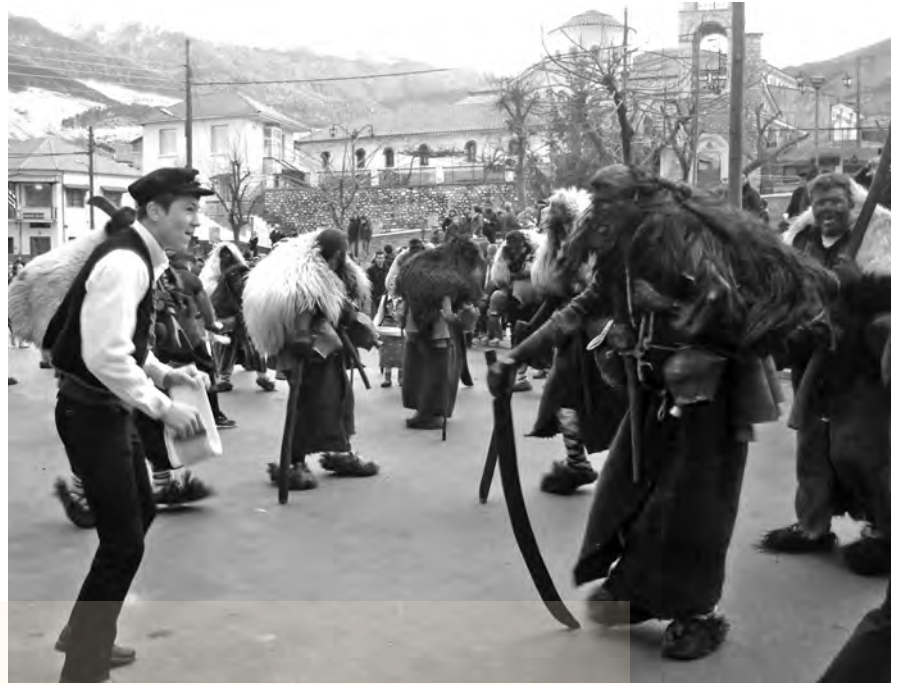
αριστερά: ο πρόσωπος της Μπούλας, δεξιά: το έθιμο των κουδονοφόρων «Αράπηδων» στο Βόλακα Δράμας

Ἀρτέμιδος καί τοῦ Διοπετοῦς; ἀνα- ντιρρήτων οὖν ὄντων τούτων δέον ἐστίν ὑμᾶς κατεσταλμένους ὑπάρ- χειν καί μηδέν προπετεές πράσσειν. ἠγάγετε γάρ τούς ἄνδρας τούτους οὔτε ἱεροσύλους οὔτε βλασφη- μοῦντας τὴν θεάν ὑμῶν. εἰ μὲν οὖν Δημήτριος καί οἱ σὺν αὐτῷ τεχνίται ἔχουσι πρὸς τινά λόγον, ἀγοραῖοι ἄγονται καί ἀνθύπατοί εἰσιν, ἐγκα- λείψωσαν ἀλλήλους. Εἰ δέ τι περὶ ἐτέρων ἐπιζητεῖτε, ἐν τῇ ἐννόμῳ ἐκκλησίᾳ ἐπιλυθήσεται. καί γάρ κινδυνεύομεν ἐγκαλεῖσθαι στά- σεως περὶ τῆς σήμερον, μηδενός αἰτίου ὑπάρχοντος περὶ οὗ δυνη- σόμεθα ἀποδοῦναι λόγον τῆς συ- στροφῆς ταύτης. Καί ταῦτα εἰπὼν ἀπέλυσε τὴν ἐκκλησίαν».