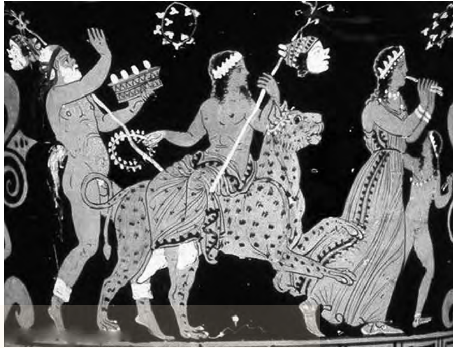
αριστερά: άγαλμα της θεάς Κυβέλης, δεξιά: Ο θεός Διόνυσος ως γυναίκα με συνοδεία, τα μέλη της οποίας κρατάνε θύρσο

ταυροφόνων ζεύξασα ταχυδρόμον άρμα λεόντων, σκιπτοϋχε κλεινοιο πόλου, πολυώνυμε, σεμνή, ή κατέχεις κόσμοιο μέσον θρόνον, οϋνεκεν αυτή γαίαν έχεις θνητοίσι τροφάς παρέχουσα προσπνεΐς. έκ σέο δ' άθανάτων τέ γένος θνητῶν τ' έλοχευθή, σοί ποταμοί κρατέονται άεί καί πάσα θάλασσα, Εστία αυδαχθεισα: σέ δ' όλβοδοτίν καλέουσι, παντοίων αγαθῶν θνητοΐς ότι δῶρα χαρίζη, έρχεο πρός τελετήν, ώ πότνια, τυμπανοτερπή πανδαμάτωρ, Φρυγίη, σώτειρα, Κρόνου συνόμενε, οϋρανόπαι, πρέσβειρα, βιοθρέπτειρα, φίλοιστρε: έρχεο γηθόσυνος, κεχαρημένη εύσεβίημισιν.