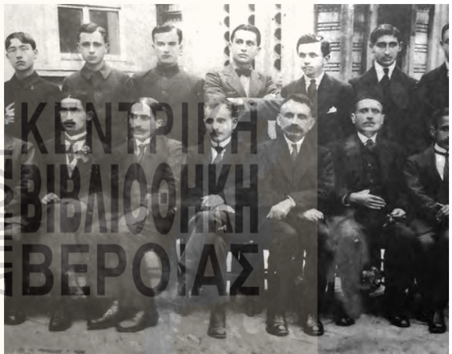
Φροντιστήριο Τραπεζούντας 1920. Καθηγητές και τελειόφοιτοι

Από τα πρακτικά των συνεδριάσεων του συλλόγου των καθη-