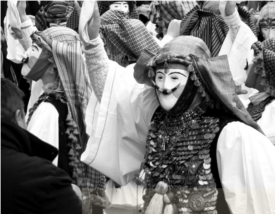
Οι Μπούλες, κορυφαίο δρώμενο της τοπικής πολιτιστικής ταυτότητας της Νάουσας

Θεότητες του δωδεκάθεου λατρεύτηκαν στον τόπο μας, ώπου εμφανίστηκε η λατρεία του Διόνυσου. Με την είσοδο στη Διονυσιακή θρησκεία η μορφή του προσώπιου αλλάζει. Δεν είναι απαραίτητο να αλλάξει και το όνομα. Μπορούν να λέγονται Βόες και να είναι τα προσώπια τραγόμορφα, όπως και ο Θεός Διόνυσος μπορεί να είναι άνδρας και γυναίκα. Δεν είναι ερμαφρόδιτος, όχι. Αφομοίωσε όμως τη θεά μπτέρα και τις ιδιότητές της. Το ίδιο και στις Μπούλες. Η προσωπίδα και ο κεφαλόδεσμος είναι ενιαίο σύνολο και παραπέμπουν σε ταύρεια δορά. Το γιορντάνι και τα ψιλά που δένονται στη μέση και φτάνουν προς το κάτω μέρος της φουστανέλας, η λεγόμενη Μπρούσλιανη σημαίνουν τη μεταβολή που έγινε με το Διόνυσο. Μερικά πράγματα δεν γίνονται τυχαία και ειδικά στα λαϊκά δρώμενα. Τα προστατεύει ο ίδιος ο λαός. Και πρέπει να επισημάνουμε ότι οι μεταβολές απαιτούν χρόνο. Κάποιοι λαοί δεν έχουν μασκοφόρα δρώμενα και αυτοί είναι οι Μουσουλ-