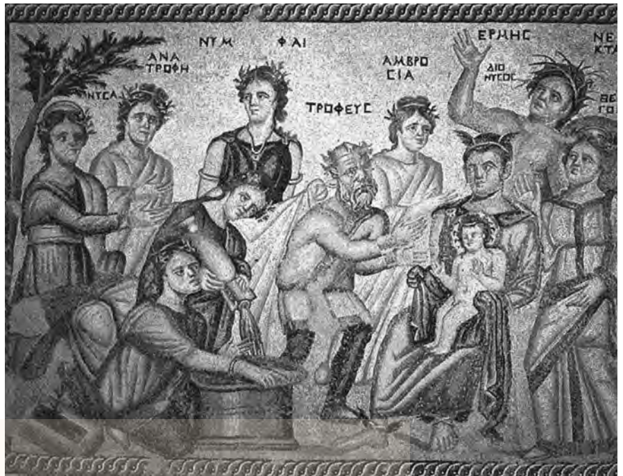
αριστερά: χρυσό στεφάνι κισσού, δεξιά: Ο θεός Διόνυσος με φωτοστέφανο και κισσό στην αγκαλιά του θεού Ερμή

χαιούτητα ανάλογα εργαστήρια. Έχουμε πολλά ευρήματα, απεικονίσεις και γραπτές μαρτυρίες για τα μασκοφόρα δρώμενα από Ελληνικές, αλλά και Ρωμαϊκές πηγές. Θα κάνω μόνο δύο αναφορές. Θα αναφερθώ στο χρυσό στεφάνι του αρχιερέα του Διόνυσου με τα χρυσά φύλλα του κισσού και δεύτερο με τα προγονικά προσώπια, που ήταν εκμαγεία, τα οποία έβγαζε ο ιερέας του Θεού από το πρόσωπο του νεκρού. Το πρώτο βρέθηκε στη Σίνδο, το δεύτερο ήταν παράδοση στην Ετρουρία.