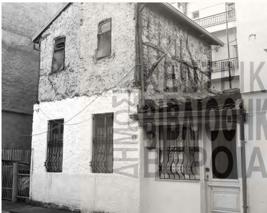
Η οικία Φωστηρόπουλου σήμερα στη Νάουσα, επί της οδού Γερβασίου 2

Στο Λάππειο Γυμνάσιο οι αγώνες τριαγμού είχαν μάλλον ομαδικό χαρακτήρα, υπό την έννοια ότι οι μαθητές διαγωνίζονταν ως εκπρόσωποι της τάξης τους και οι νίκες προσμετρούνταν σε μια κοινή, ομαδική βαθμολογία. Αυτό τουλάχιστον προκύπτει από σχετικό άρθρο της εφημερίδας Πρόοδος (9-6-1929) για τις γυμναστικές επιδείξεις στο τέλος της χρονιάς: