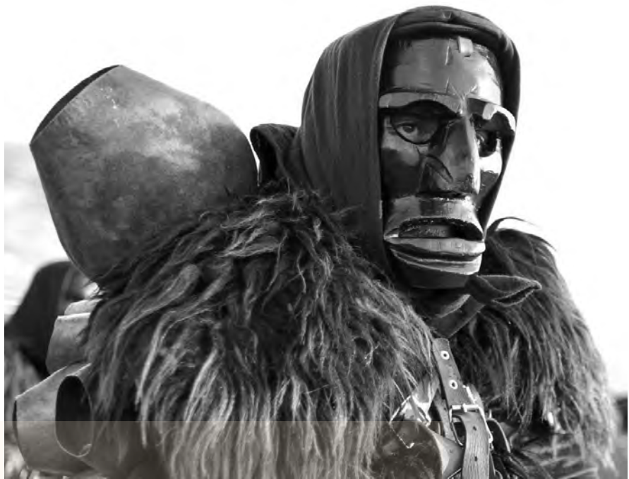
Κουδονοφόρος από μασκοφόρο δρώμενο στη Σαρδηνία της Ιταλίας

Τι μπορεί να είναι μια μάσκα; Μπορεί να είναι πολεμική; Γιατί