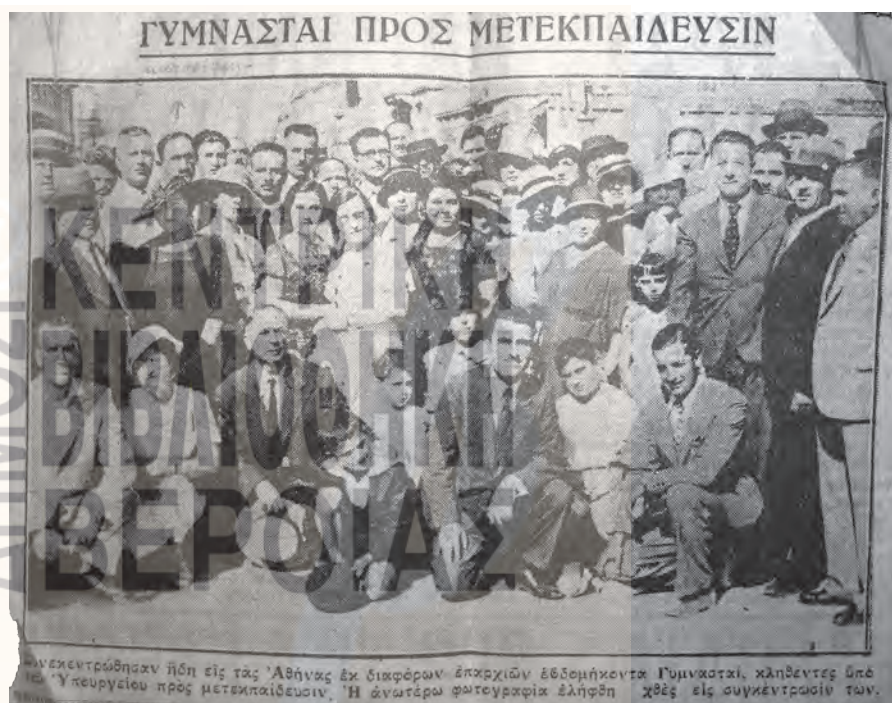
Οι μετεκπαιδευόμενοι γυμναστές του 1930

μαθητών του στην ενόργανη γυμναστική παρά μόνο μετά το 1934. Τότε διατέθηκαν 10.811,20 δρχ. για αγορά και εγκατάσταση γυμναστικών οργάνων με βάση έσοδα του γυμνασίου από έρανο και σχετική δωρεά της εταιρείας Γρηγορίου Τσίτση και Σία. Ειδικότερα, στο βιβλίο πράξεων της σχολικής εφορείας (πράξη ΚΕ' της 14ης Δεκεμβρίου 1934) αναφέρεται η αγορά δέκα πολυζύγων, δύο δοκών, έξι εδράνων, ενός εφαλτηρίου και 8 εμποδίων. Μαζί με τα γυμναστι-