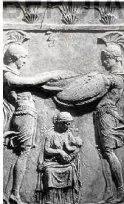
Ανάγλυφη αναπαράσταση: στο κέντρο η Μπτέρα Θεά και γύρω από αυτήν συνοδοί Κουρήτες

Σχετικά με τους Κουρήτες ένας πανάρχαιος ορφικός ύμνος μας λέει ότι οι συνοδοί αυτής της