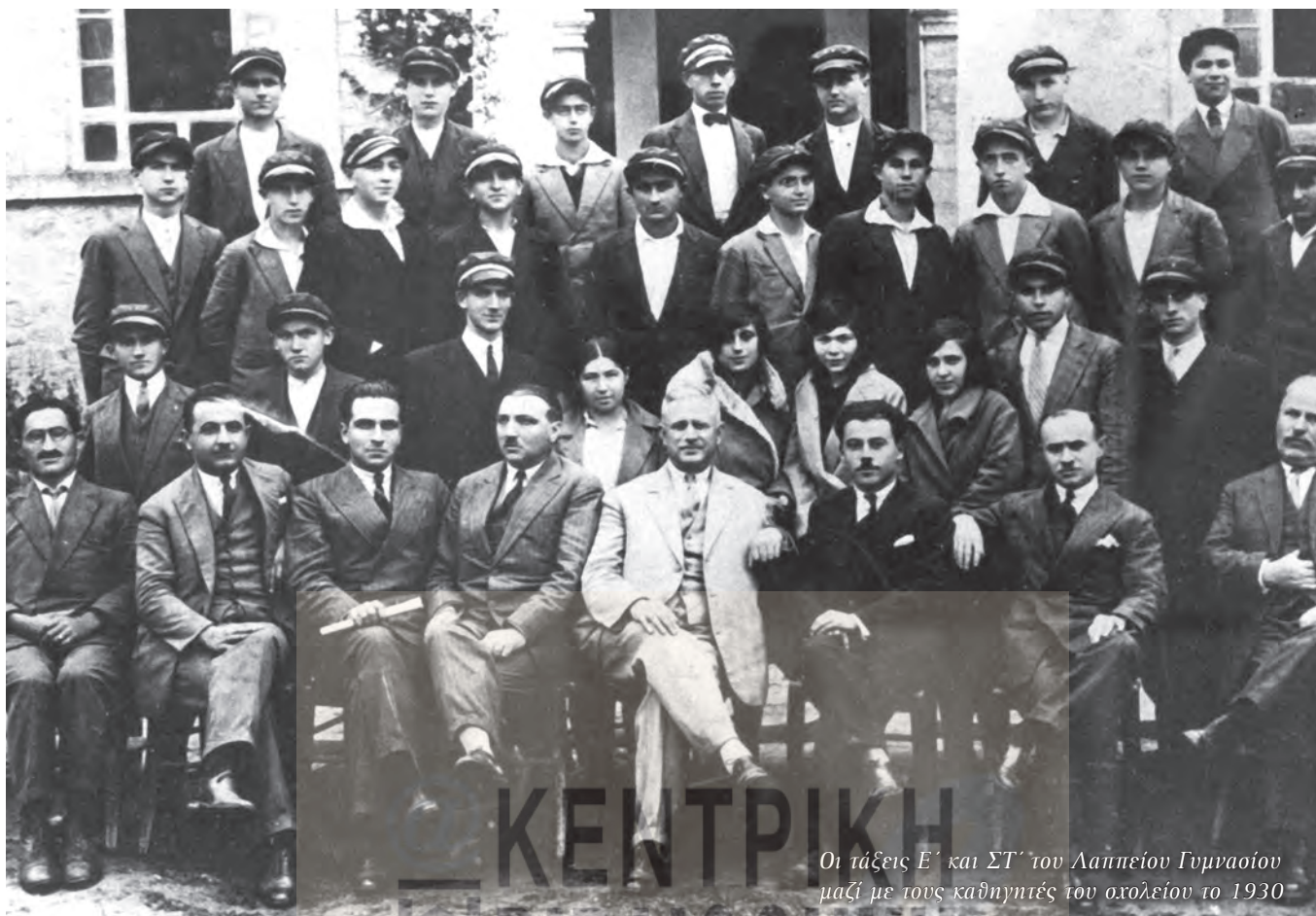
Οι τάξεις Ε' και ΣΤ' του Λαιπείου Γυμνασίου μαζί με τους καθηγητές του σχολείου το 1930