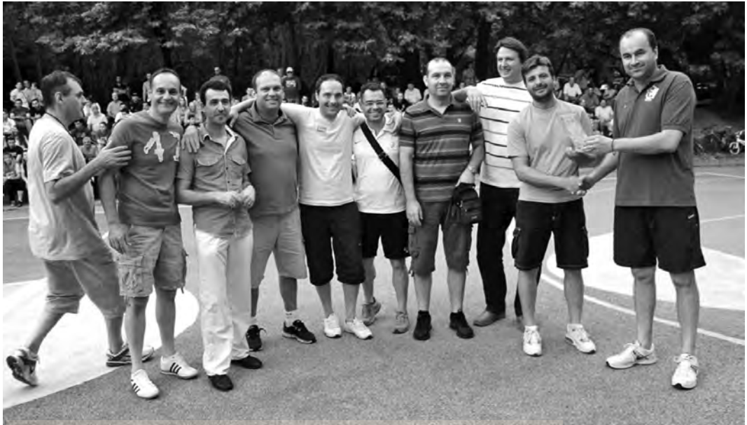
Απονομή τιμητικών επάθλων συμμετοχής σε ομάδα στο τουρνουά μπάσκετ Αγίου Νικολάου το 2013

και κοσμικές περγαμνές: Ντεϊβιντ Ίνγκραμ, Αλφόνσο Φόρντ, Χένρι Τέρνερ, Όντι Νόρις, Μπόμπα Γιάνκοβιτς, Αντόνιο Ντέιβις, Μπάρρον Ντίνκινς, Μάικ Τζόουνς, Γουόλτερ Μπέρι και Ζόραν Σάβιτς, Μπάνε Πρέλεβιτς και οι δικοί μας Άγγελος Κορωνιός, Μηνάς Γκέκος, Λευτέρης Κακιούσης, Φραγκίσκος Αλβέρτης, Γιώργος Σιγάλας, Ευθύμης Ρεντζιάς.