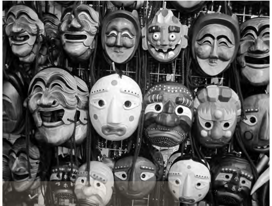
αριστερά: μάσκα από την Κίνα, δεξιά: παραδοσιακές μάσκες στη Νότια Κορέα κατασκευασμένες από ξύλο