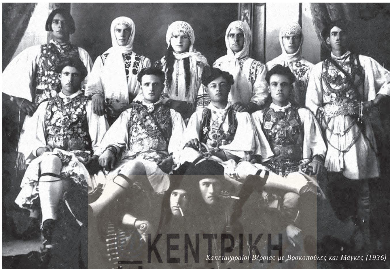
Καπεταναραίοι Βέροιας με Βοσκοπούλες και Μάγκες (1936)