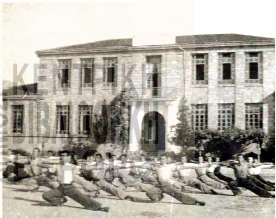
Γυμναστικές επιδείξεις της δεκαετίας του 1930. Σουηδική γυμναστική. (αρχείο Αφρ. Λίτη)

κά για τη σουηδική γυμναστική και τις παιδιές. Η αυλή διέθετε, επιπλέον, σκάμμα με άμμο για τα άλματα και φιλέ για την πετοσφαίριση. Το κτίριο του κλειστού γυμναστηρίου του σχολείου οικοδομήθηκε το 1933-34, παρέμεινε όμως ημιτελές και εκτός χρήσης για μεγάλο χρονικό διάστημα. Γι' αυτό και τις βροχερές και κρύες μέρες του χειμώνα ο Φωστηρόπουλος δίδασκε, σύμφωνα με προφορική μαρτυρία, μέσα στην αίθουσα διδασκαλίας. Τις μέρες